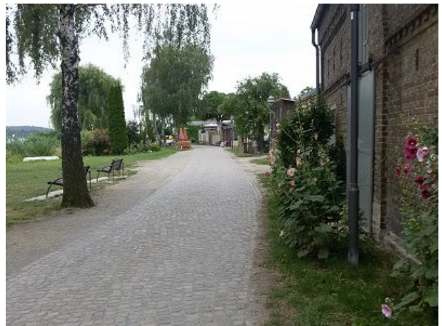
Seepromenade auf der Insel