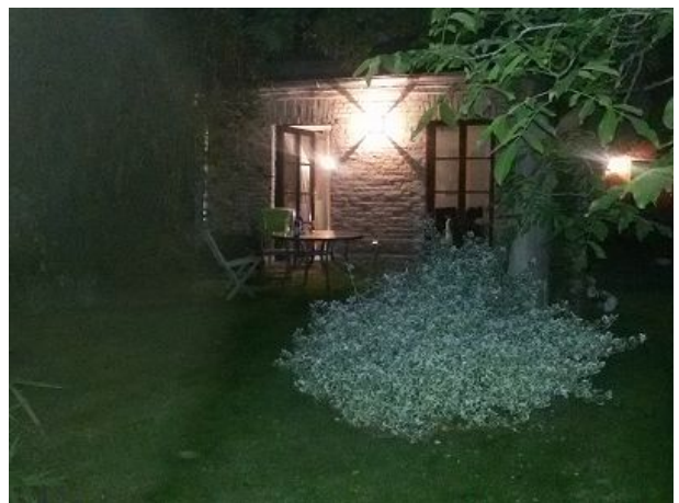
Blick aus der FEWO