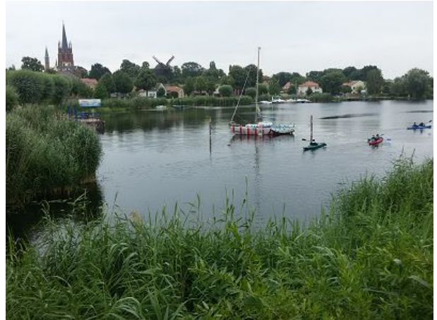
Blick auf die Insel mit Bockwindmühle