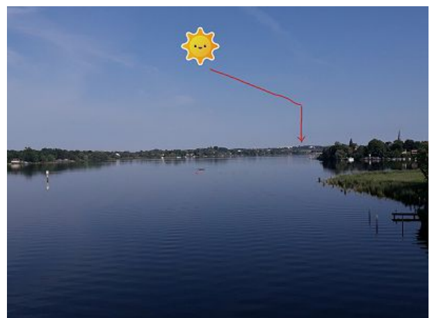
Blick von der Baumgartenbrücke Geltow