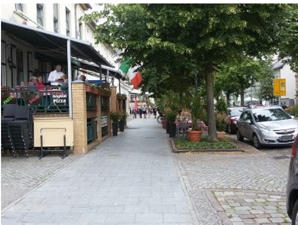
Stadtzentrum Unter den Linden