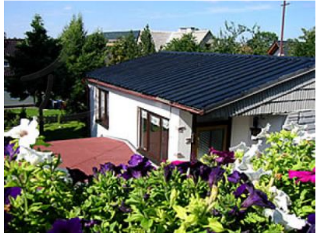
Ferienhaus im Sommer