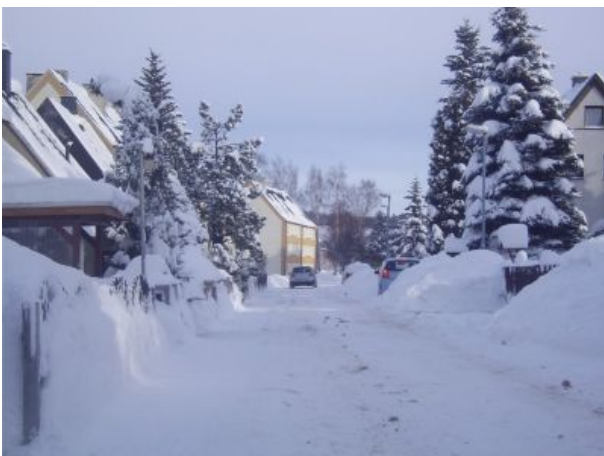
unsere Straße im Winter