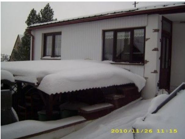
Ferienhaus im Winter