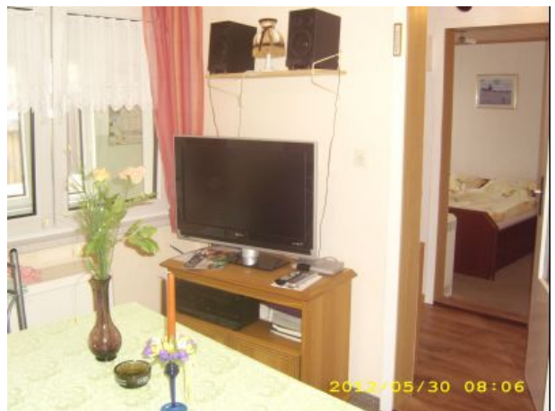
Wohnraum mit TV