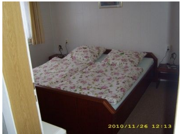
großes Sz mit Doppelbett