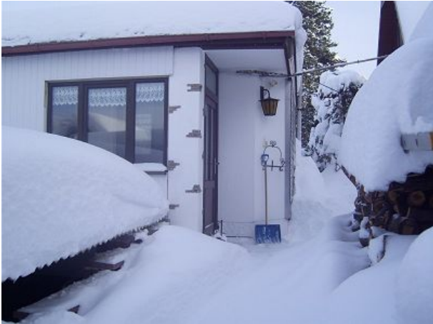
Eingang zum Ferienhaus