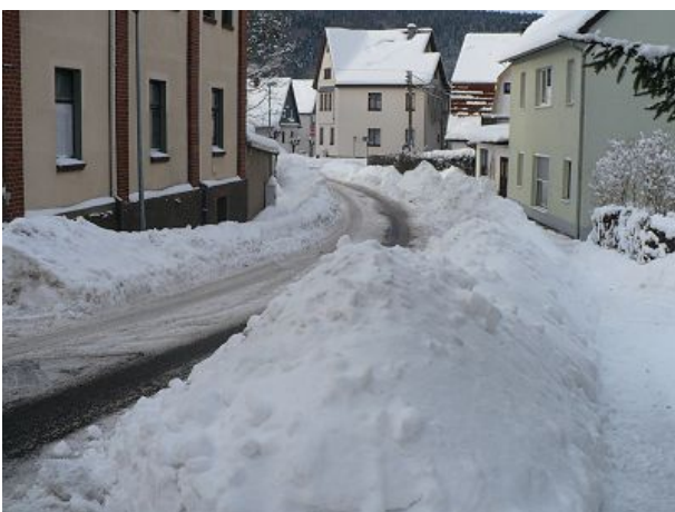
Zella-Mehlis im Winter