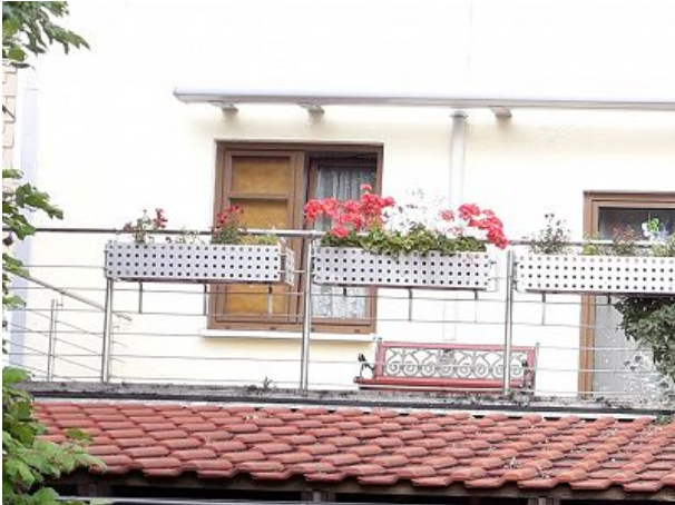
Terrasse mit Sitzmöglichkeiten