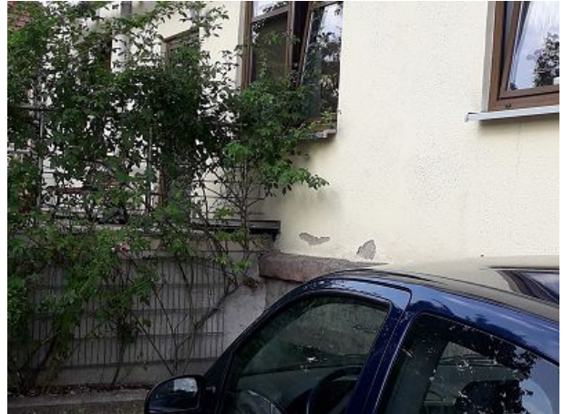
Parkplatz am Haus