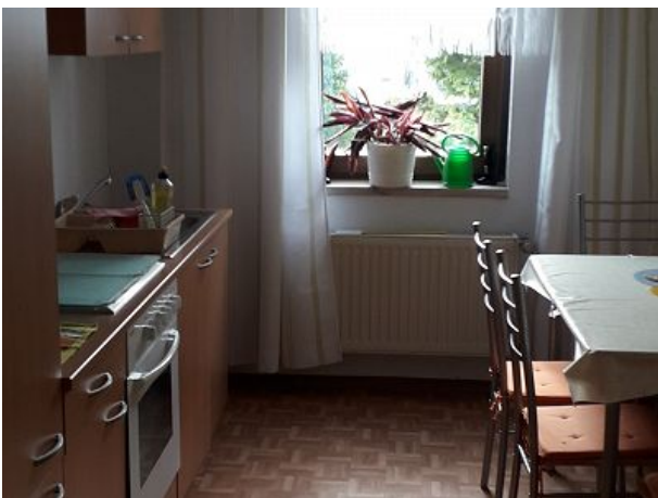
Küche mit Esstisch und Stühle