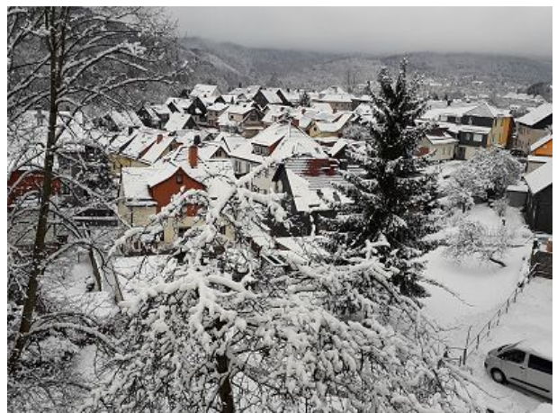
Zella-Mehlis im Winter