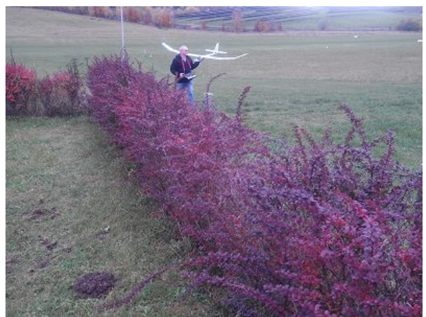
Modellfliegen ist möglich