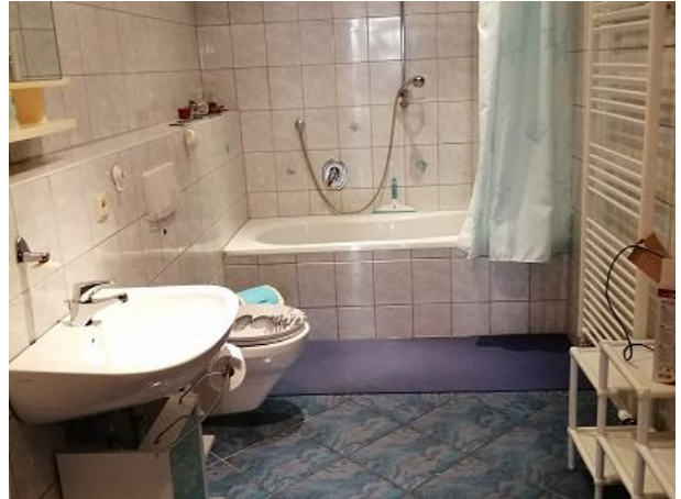
Bad mit Wanne und Duschkmöglichkeit