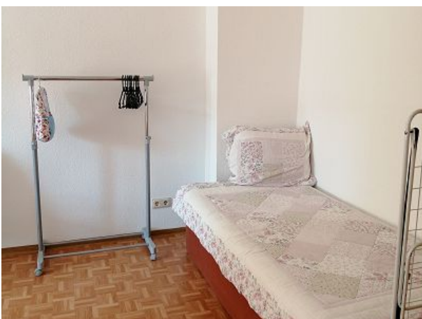
Zusatzbett im Schlafzimmer