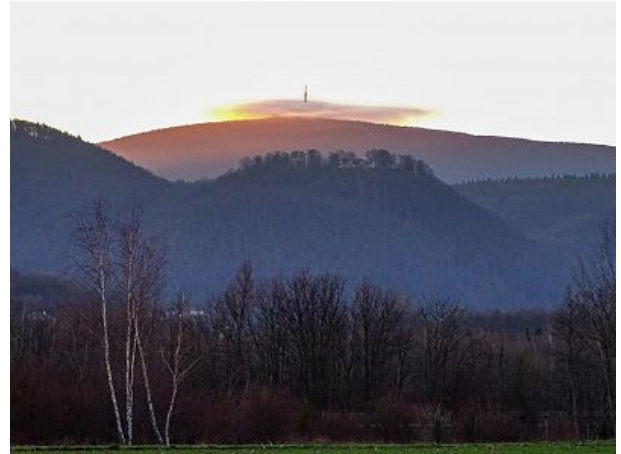
Burgberg und Brocken