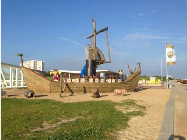
Piratenschiff am Strandhaus Döse