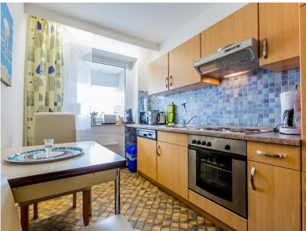
Einbauküche mit Geschirrspüler