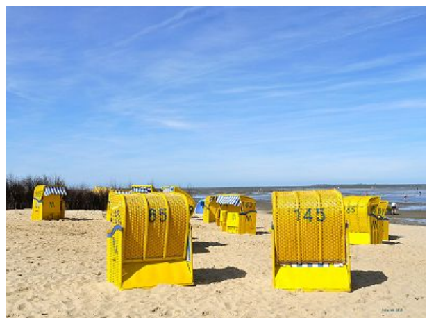
Strandkörbe im Sandstrand