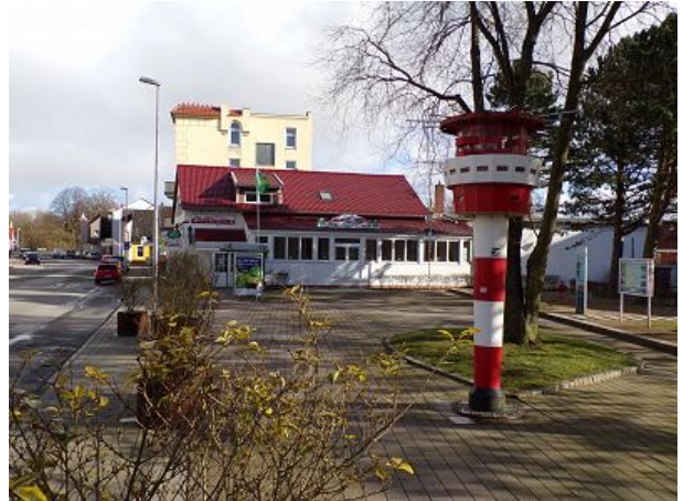
Leuchtturm am Dorfplatz Döse