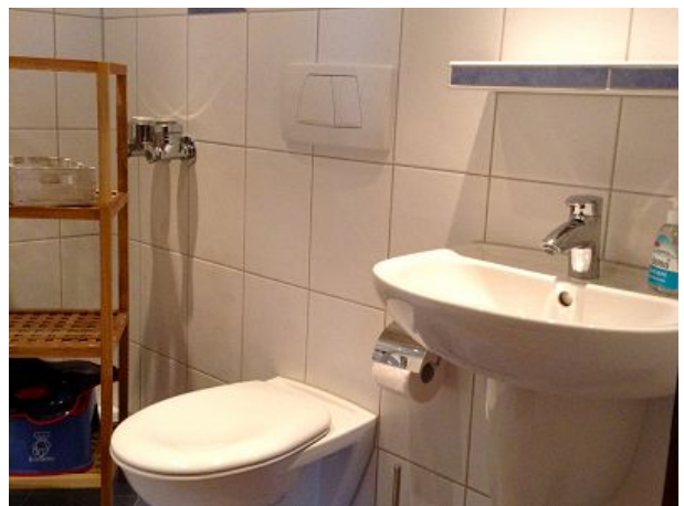
Doppelbad mit zwei WC im Duschkabinenbereich