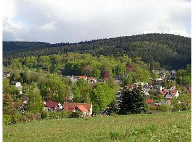
Blick auf Elgersburg