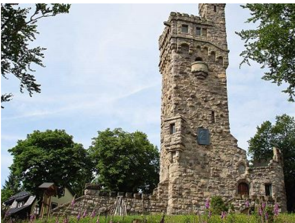
Aussichtsturm Hohe Warte