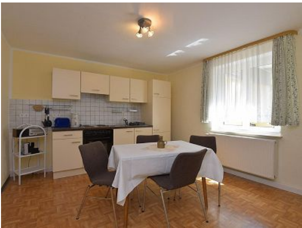
Küche mit Essecke