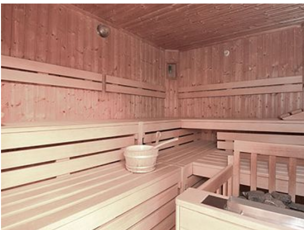
Sauna zur Entspannung