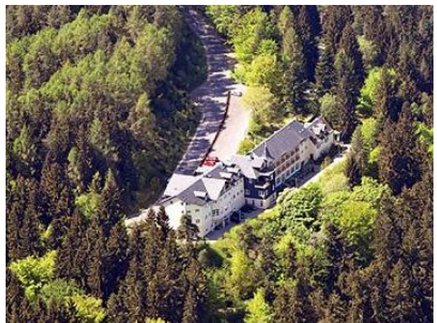
Unser Hotel am Wald