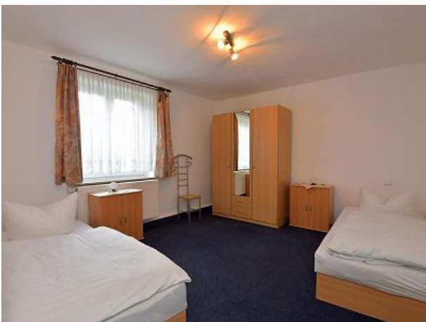
Schlafzimmer mit Einzelbetten