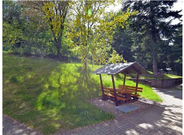
Sitzgelegenheit im Freien