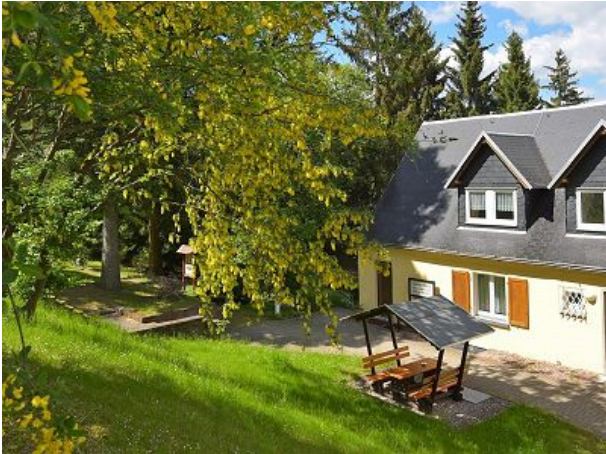
Unser Haus mit Garten