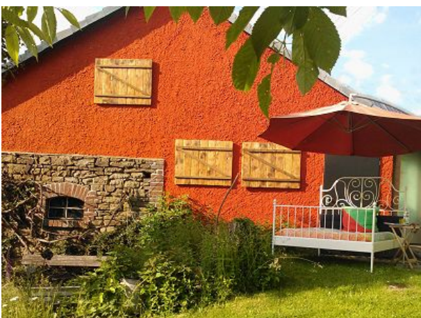
An der Scheune