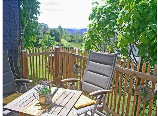
Südbalkon mit Siegtalblick