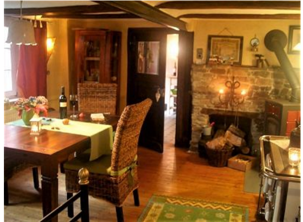
Essplatz am Kamin