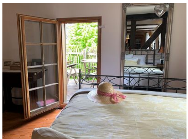
Schlafbereich mit Balkonblick