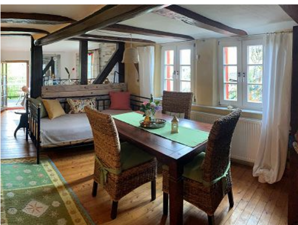
Blick in die Gute Stube