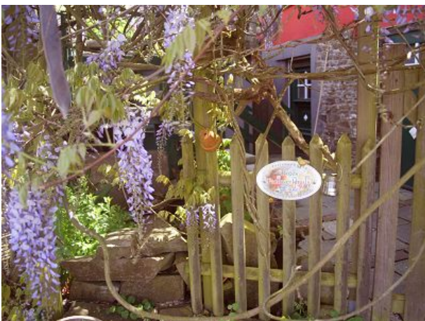
Blauregen am Eingang