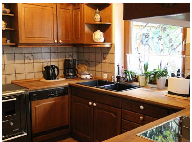
Gut ausgestattete Küche