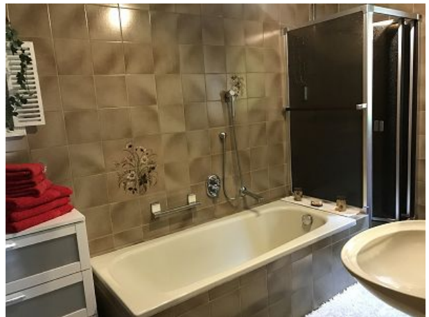
Bad mit Dusche Badewanne und WC