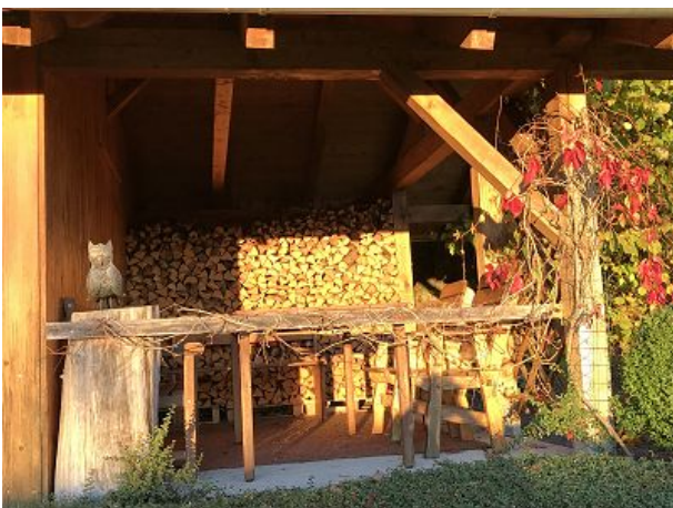
Schöne Waldhütte mit Fernblick