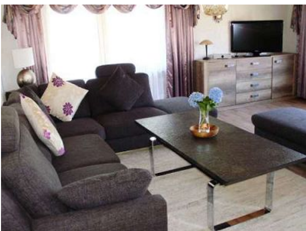
Wohnzimmer mit Balkonzugang