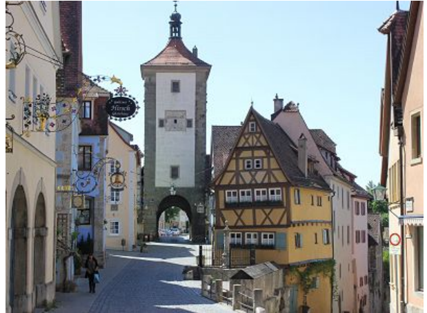
Rothenburg ob der Tauber