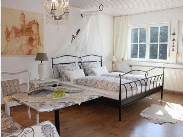
Die Bebenburg mit Blick ins weite Grün