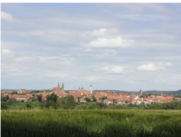
Rothenburg ob der Tauber