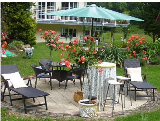
Sonne von früh bis spät