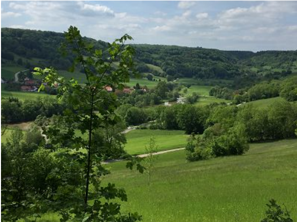
Traumhaft schönes Jagsttal