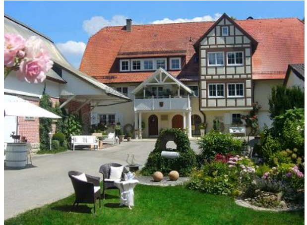
Willkommen in der Aumühle