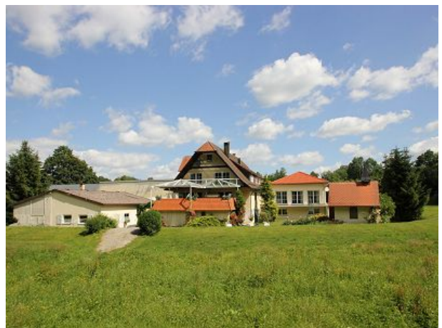
Inmitten gepflegter Grünanlage