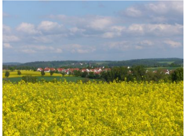
Rot am See