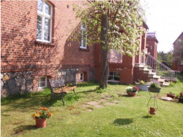
Hofeingang zu Fewos Eins und Vier