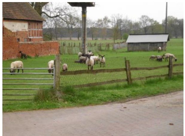
Roddaner Dorfidyll am Rundling