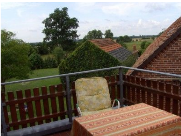
Balkon FEWO Zwei