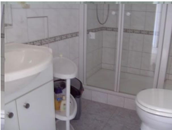
Duschbad FEWO Zwei