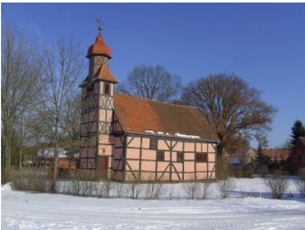
Roddaner Dorfkirche im Winter