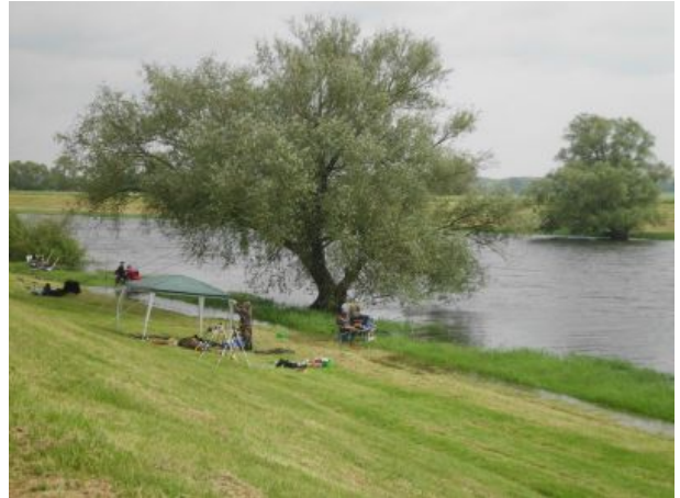
Angler am Havelarm