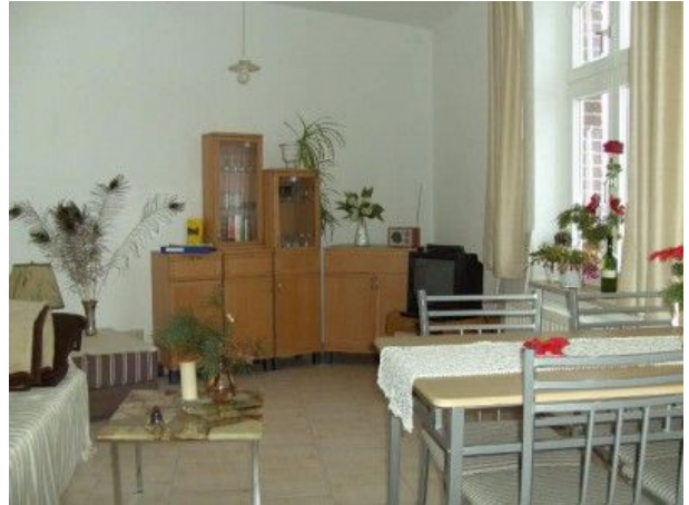
Wohnzimmer FEWO Zwei