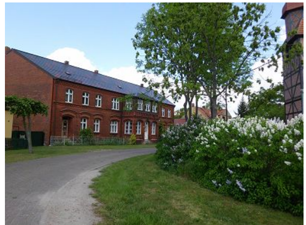
Roddaner Dorfstraße mit Muxfeldts Haus