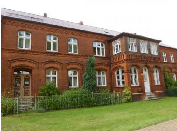
Hauseingang FEWO Zwei vom Rundling