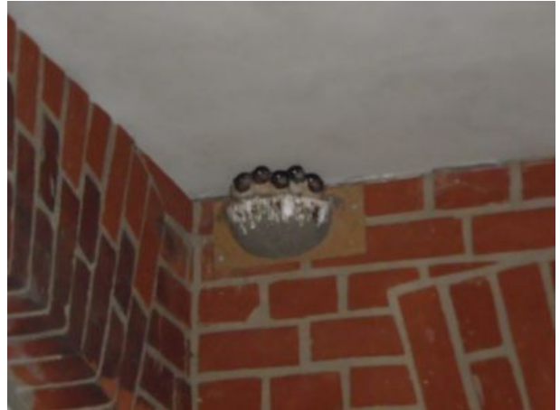
Schwalben sind bei uns zuhause