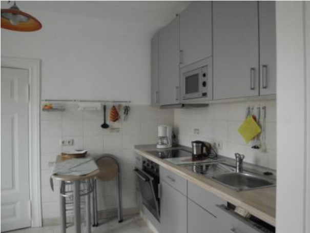
Einbauküche FEWO Zwei