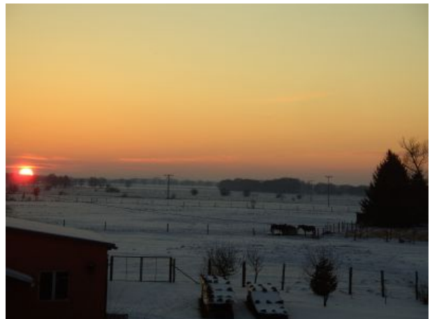
Winterlandschaft vom Fenster FEWO Eins