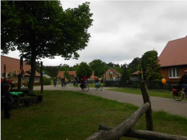
Tour de Prignitz fährt ein in Roddan