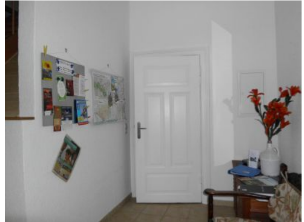
möglicher Durchgang Fewos Zwei und Drei