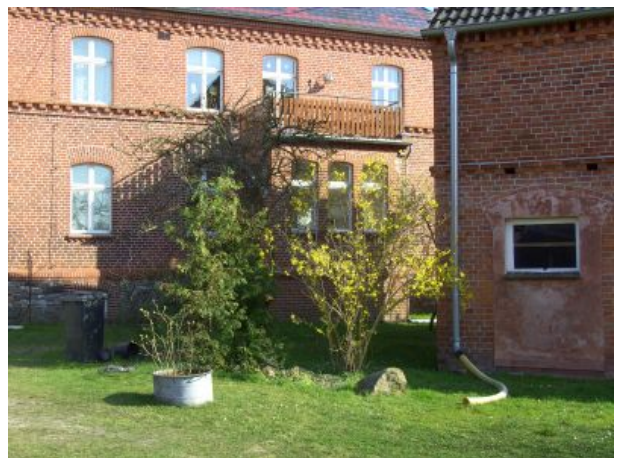
Balkon FEWO Zwei vom Hof aus gesehen