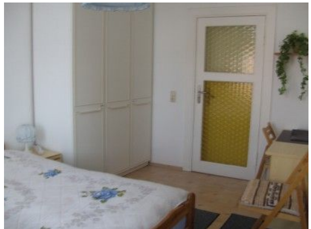
Schlafzimmer FEWO Zwei mit Schreibtisch