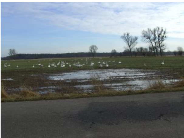
Schwäne rasten an der Karthane