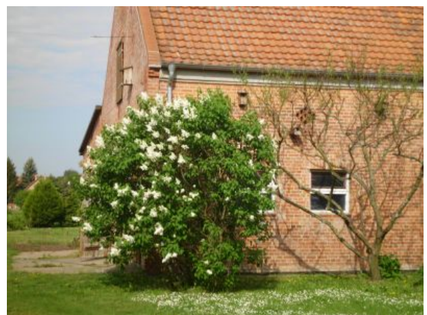
Raum für den Sitzplatz unter Flieder