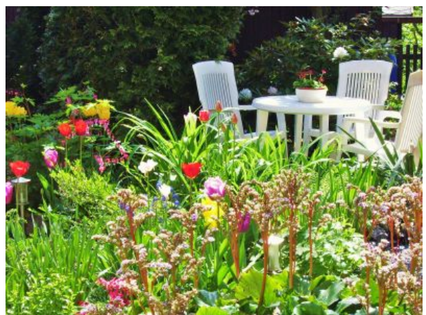
noch eine Sitzecke