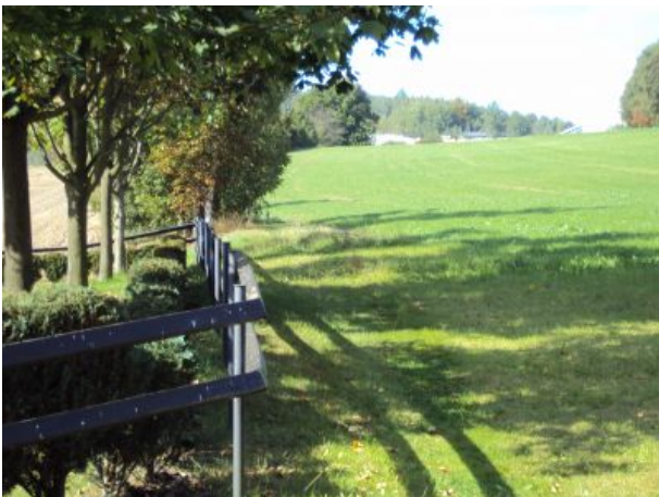
hinter dem Haus nur Natur