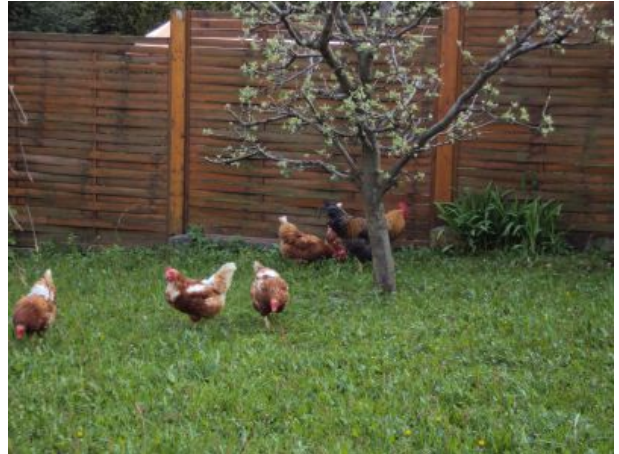
frische Frühstückseier für Sie