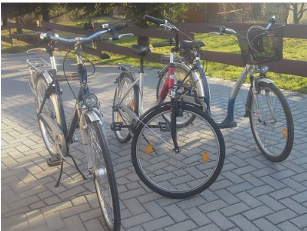
Räder für Sie kostenlos