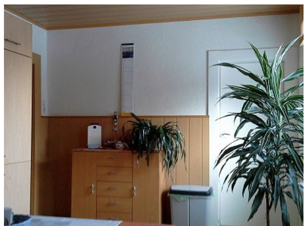
noch eine Küchenansicht