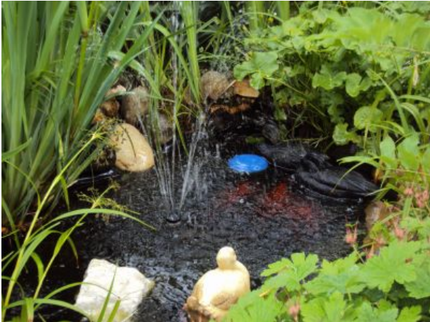
unser kleiner Teich