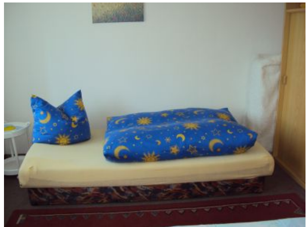
und ein Einzelbett