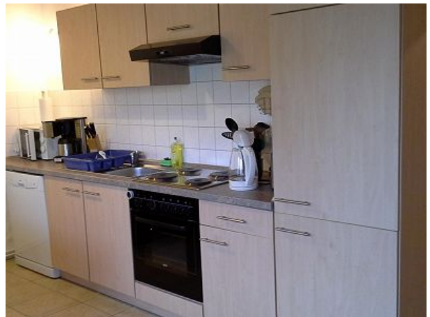
Küche mit allen E- Geräten