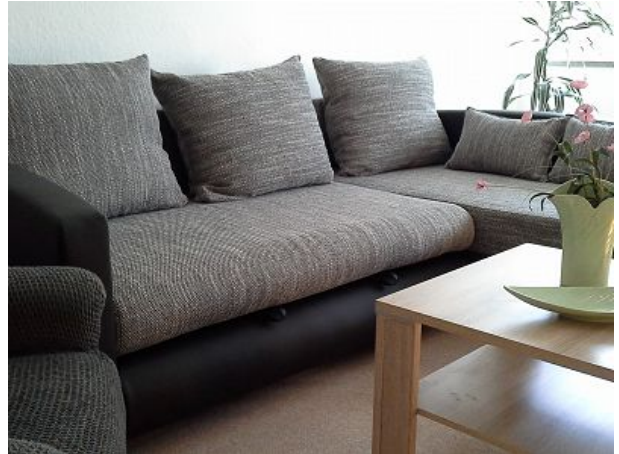
Wohnzimmer ein Schlafplatz