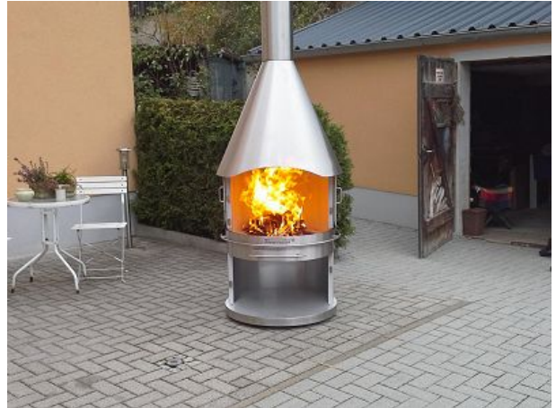
für kühlere Abende