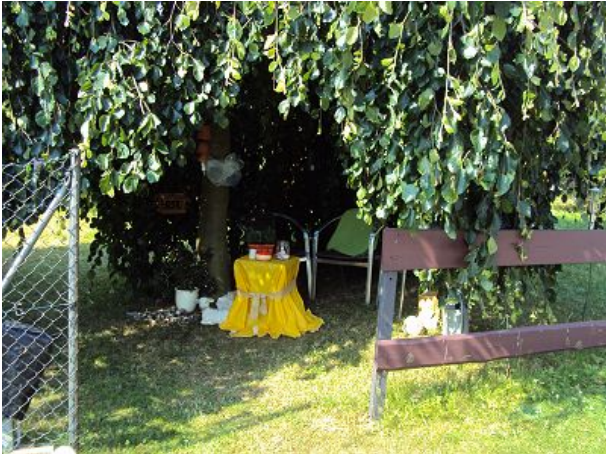
unter unserer Hängebuche