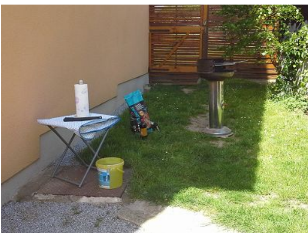
Grill Kohle kostenlos