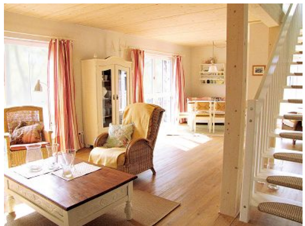
Wohnzimmer mit Treppe ins Dachgeschoss