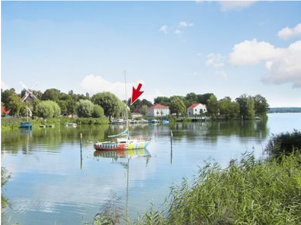
Blick auf die Werder-Insel