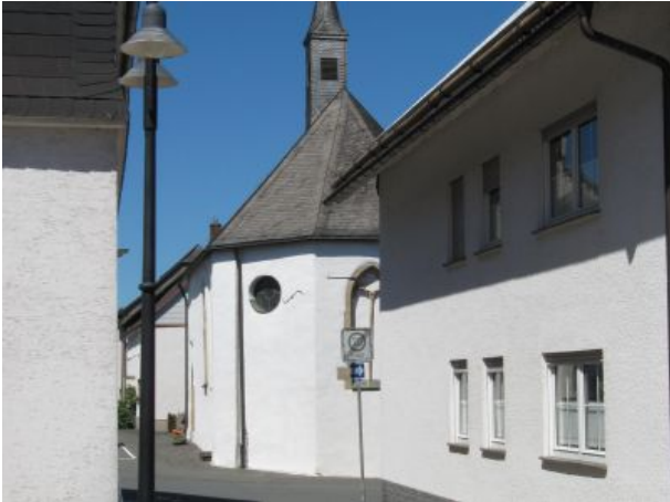
Kirchstraße mit Andreaskapelle