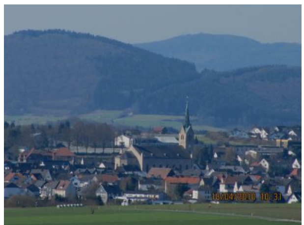
Blick auf Medebach