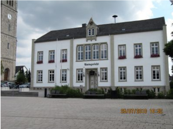
Marktplatz mit Amtsgericht