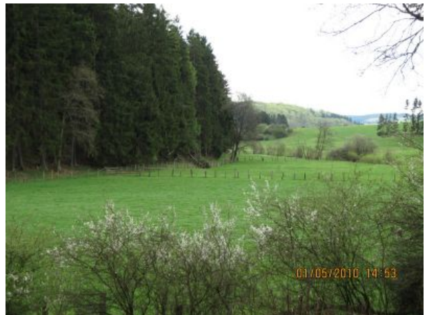
Durch Wald und Feld