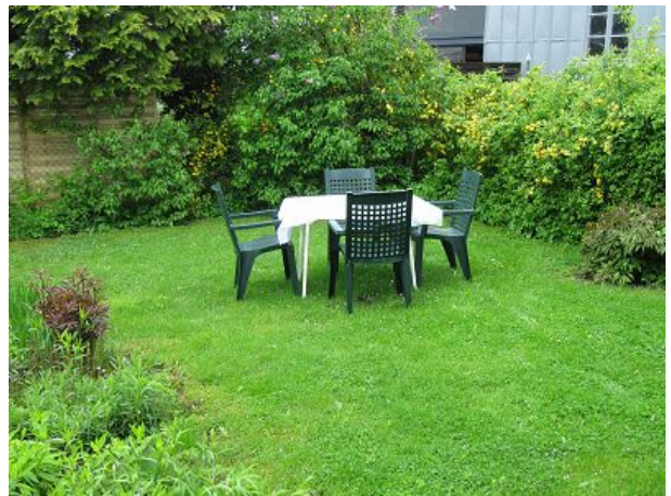
Sitzplatz im Garten