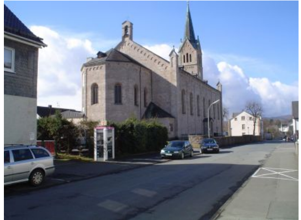
Kirche Sankt Peter und Paul