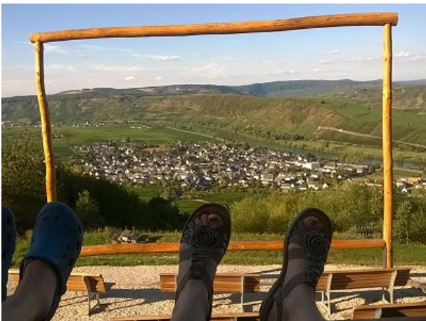
schöner Blick auf den Ort