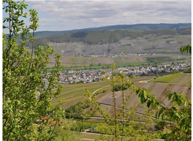
Blick zum Ort