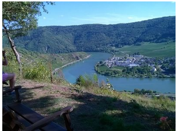
unterwegs beim wandern