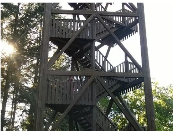
vom Aussichtsturm unterwegs