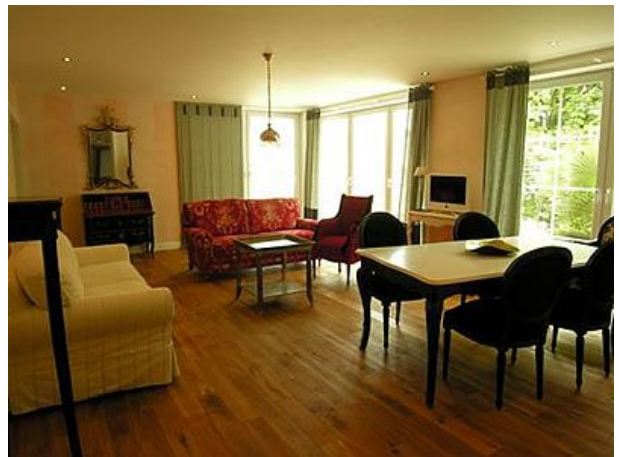
Il Grande Wohnen