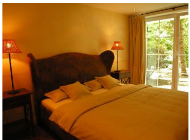
La Pergola Schlafzimmer