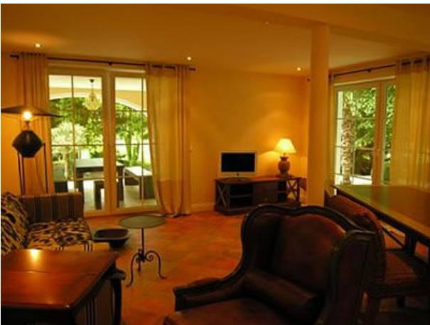
Il Giardino Wohnen