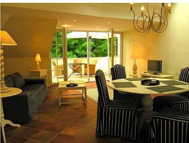
La Mansarda Wohnen