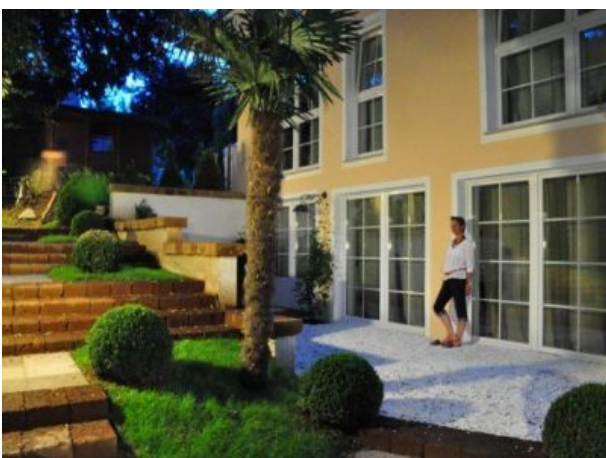
Park Villa Eingang Il Giardino