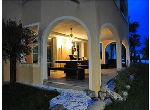
Il Giardino Terrasse