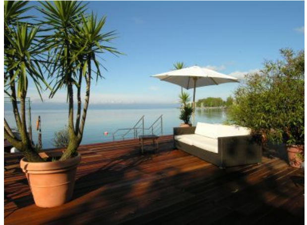
Pension am Bodensee Seeterrasse