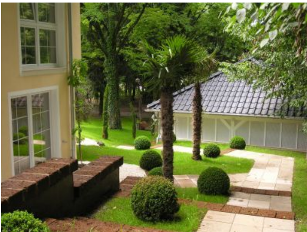
Zugang zur Park Villa