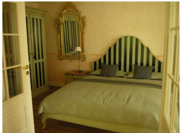
Il Grande Schlafzimmer