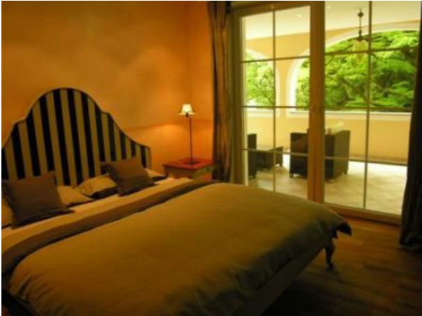
Il Grande Schlafzimmer