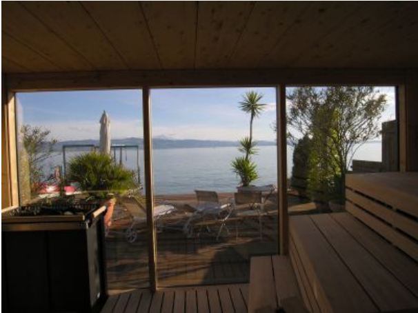
Sauna Pension am Bodensee