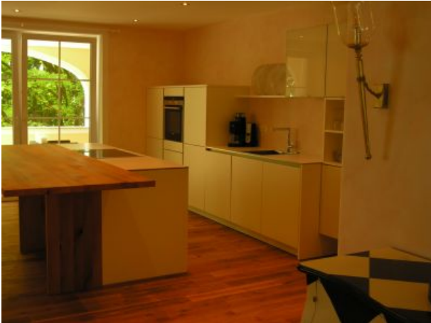
Il Grande Küche