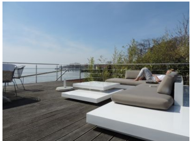
Pension am Bodensee Strand