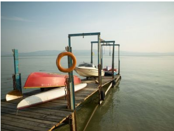
Pension am Bodensee Bootssteg