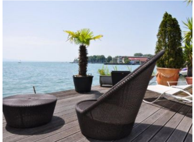
Strand Pension am Bodensee