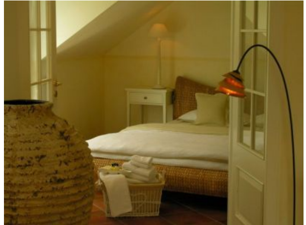
La Bella Schlafzimmer