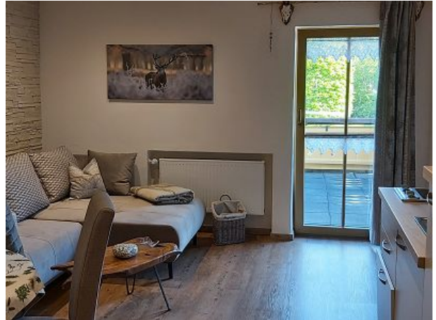
Wohnzimmer mit Küchenzeile