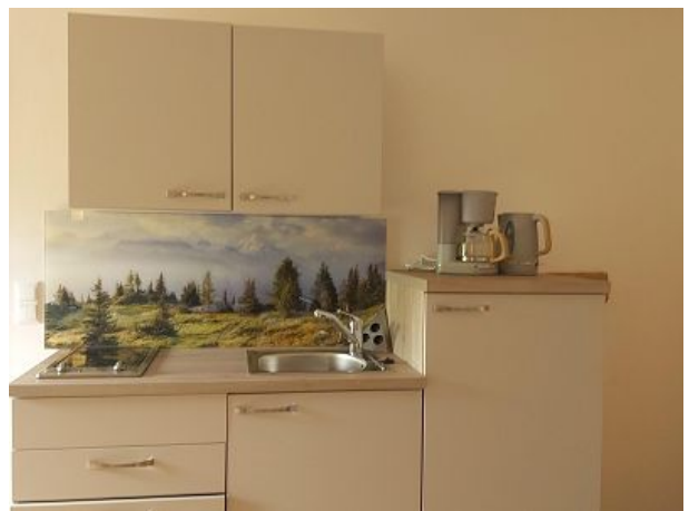
Küchenzeile im Wohnbereich