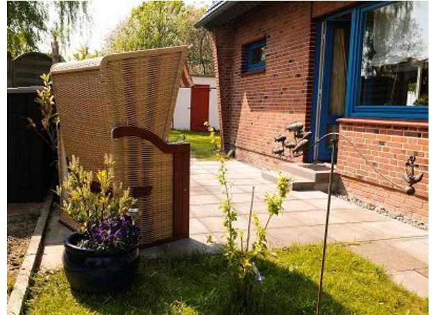
Charmant und schnuckelig mit Garten