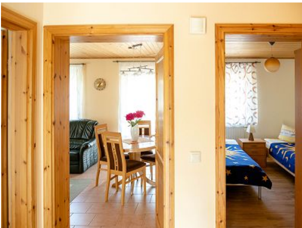
Blick in den Flur