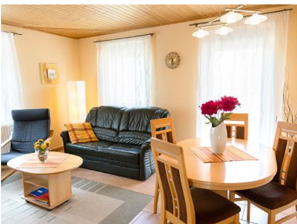
Blick zur Terrassentür