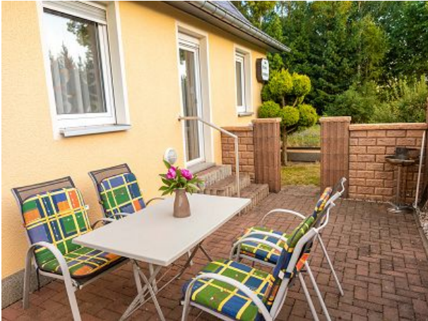
Terrasse mit Grillmöglichkeit