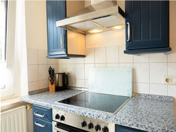
Küche mit Herd und Backofen