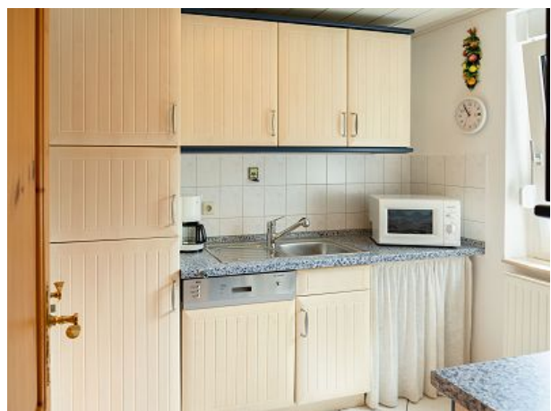
Küche mit Geschirrspüler