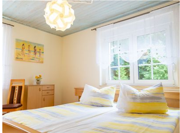
Schlafzimmer mit Doppelbett