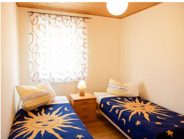
Schlafzimmer mit Einzelbetten