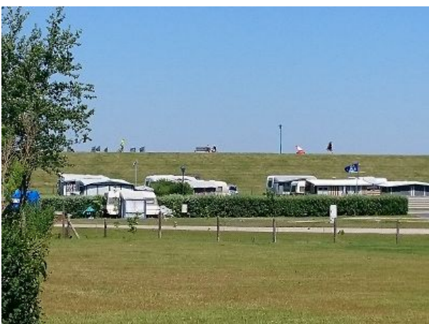
Blick zum Deich