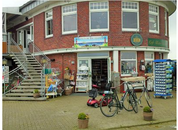
Souvenirgeschäft am Hafen