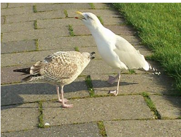
Gespräch unter Einheimischen