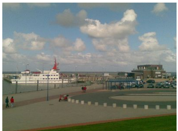
Fähre nach Spiekeroog