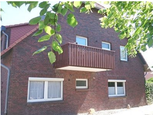
Außenansicht mit Balkon