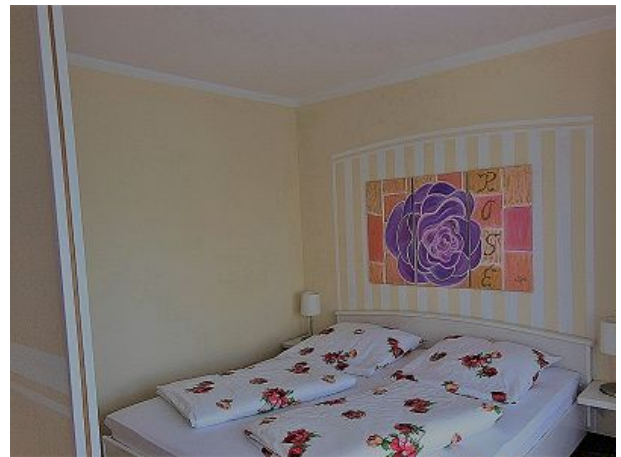
Schlafbereich mit Raumteiler