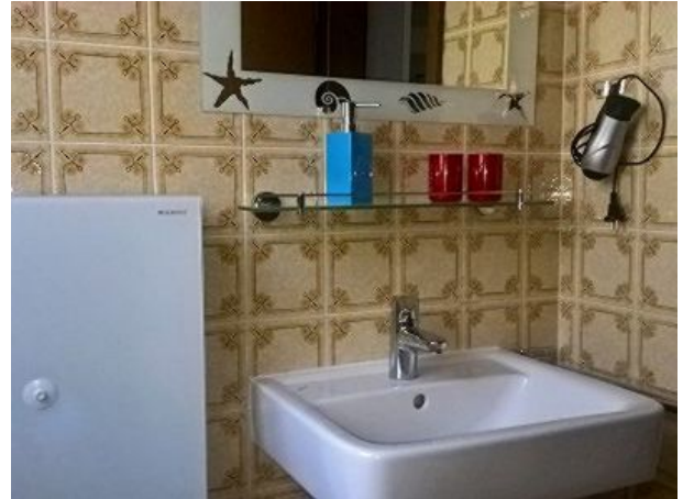
Bad mit Badewanne