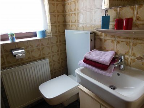
Bad mit Fenster