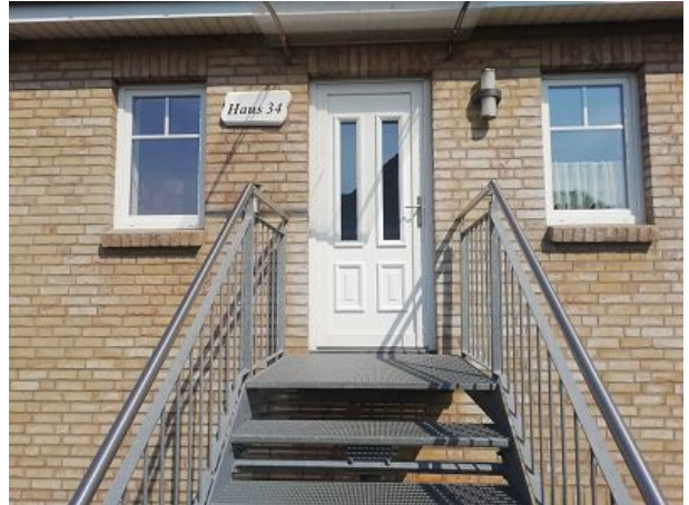
Eingang Haus vierunddreißig