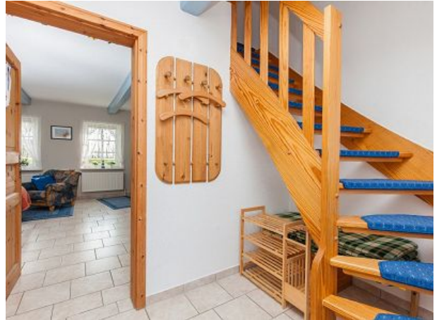
Flur mit Ausgang zum Obergeschoss