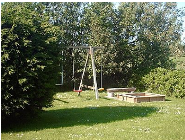
für die Kleinen