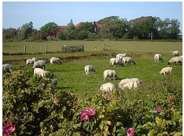
Blick über die Wiesen