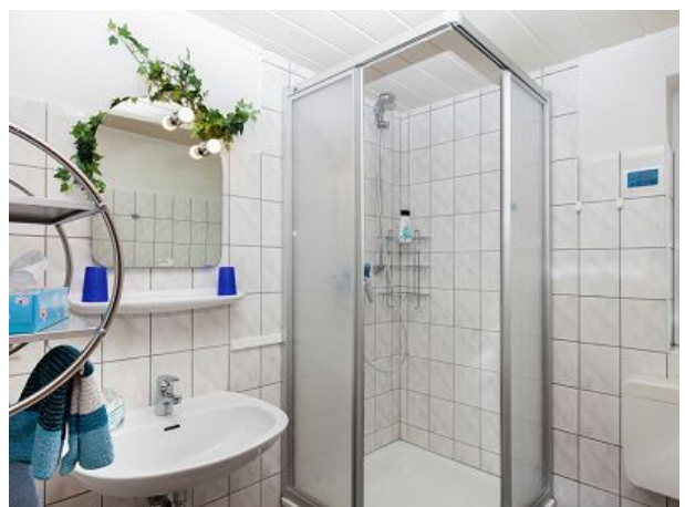
Duschbad mit Föhn