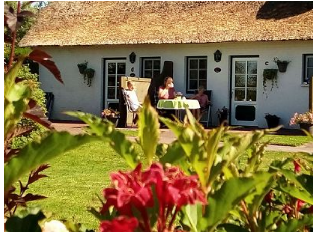
Eigener Eingang mit Terrasse