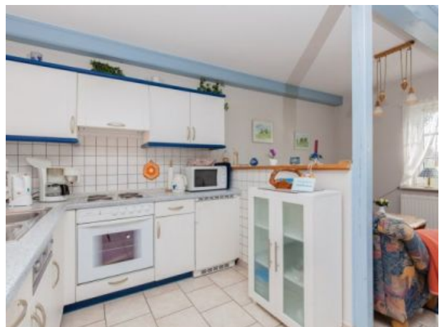
Integrierte Einbauküche im Wohnraum