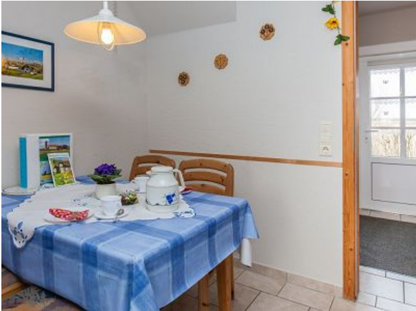
Wohnraum mit Essplatz