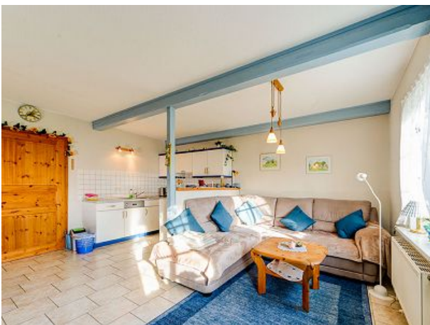
Wohnraum mit Couchrundecke