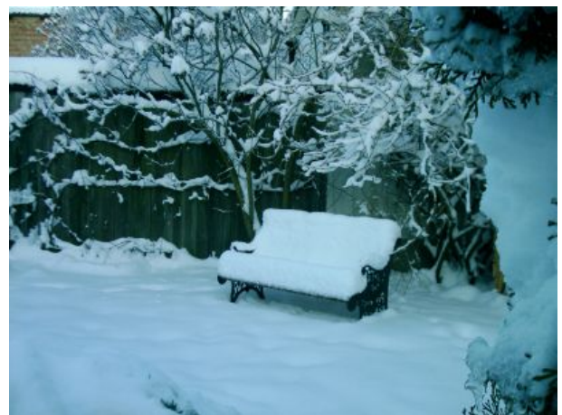
Garten im Winter