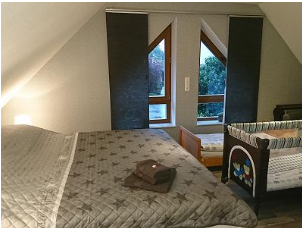
Zwei unserer Kinder- bzw. Babybetten