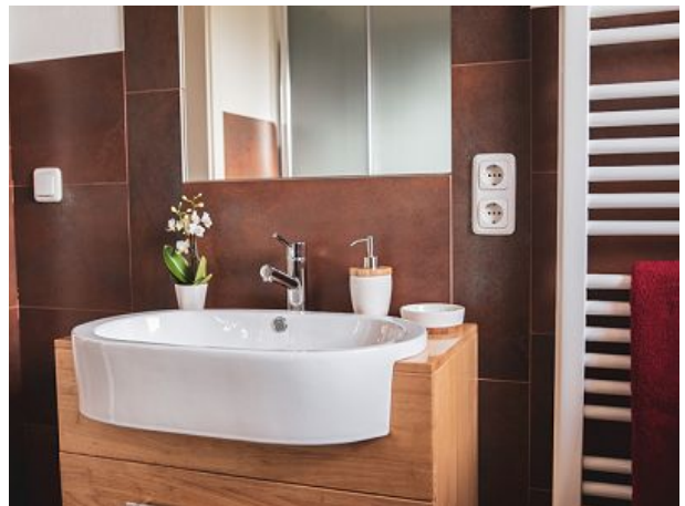
Waschbecken und Handtuchtrockner