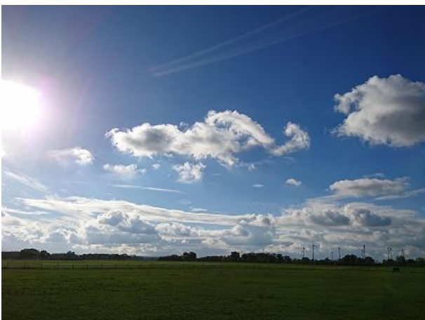
Ausblick Terrasse über die Pferdewiese