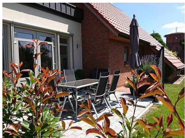
Eigener kleiner Garten mit Terrasse