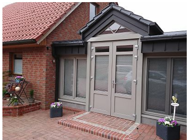
Frontansicht Eingang Ferienhaus