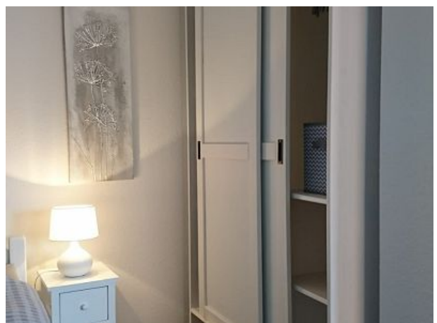
Einzelzimmer OG - mit Vorhang abtrennbar