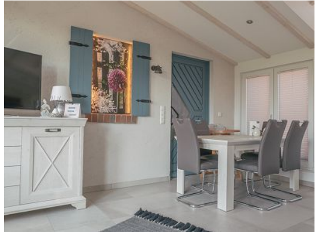
Essbereich im Wintergarten