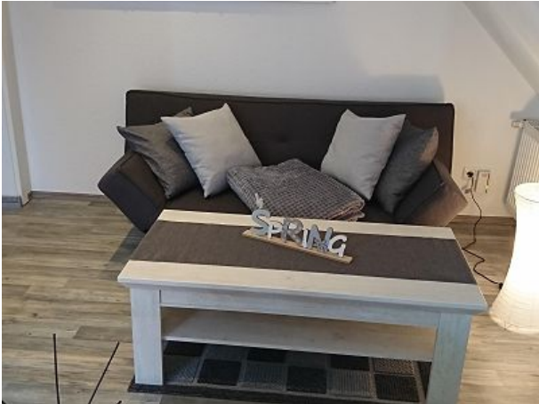
Zweiter Wohnbereich mit TV im OG