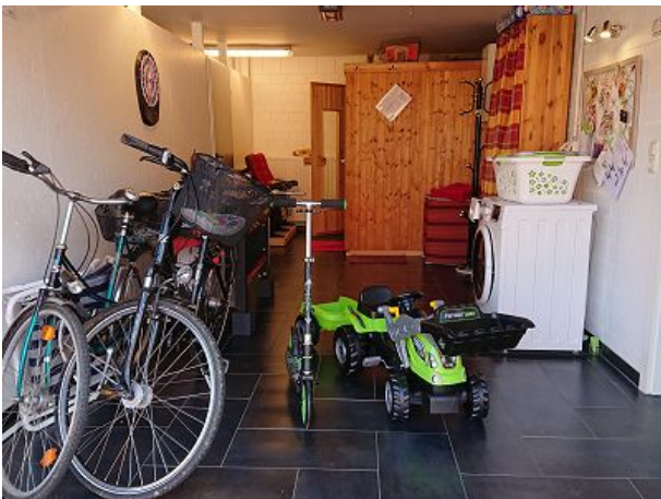
Mehrweckraum mit Fuhrpark und Sauna