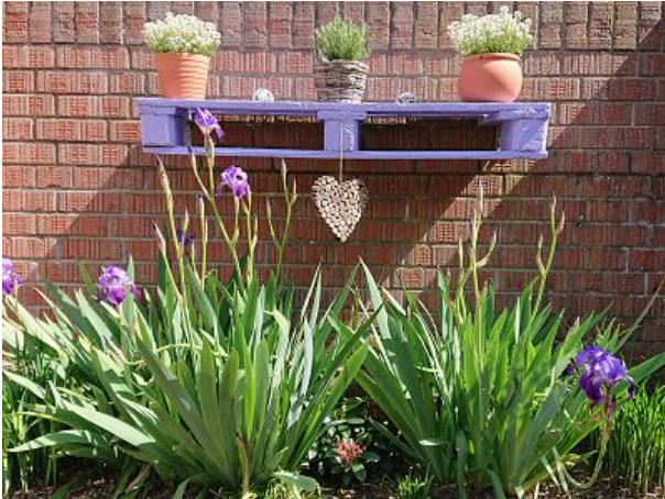
Am Parkplatz auf dem Hof des Hauses