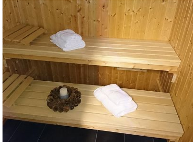
Sauna mit Aufgussöfen