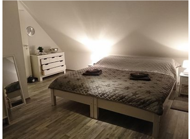
Doppelzimmer - Betten zusammengeschraubt