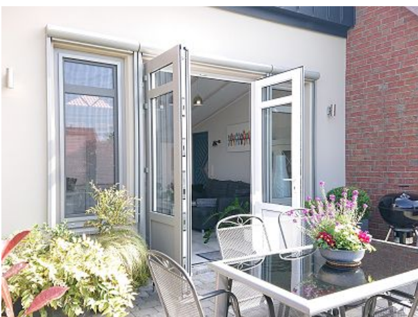
Terrasse mit Blick in den Wintergarten