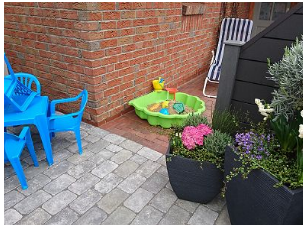
Kindersitzgruppe und Sandmuschel