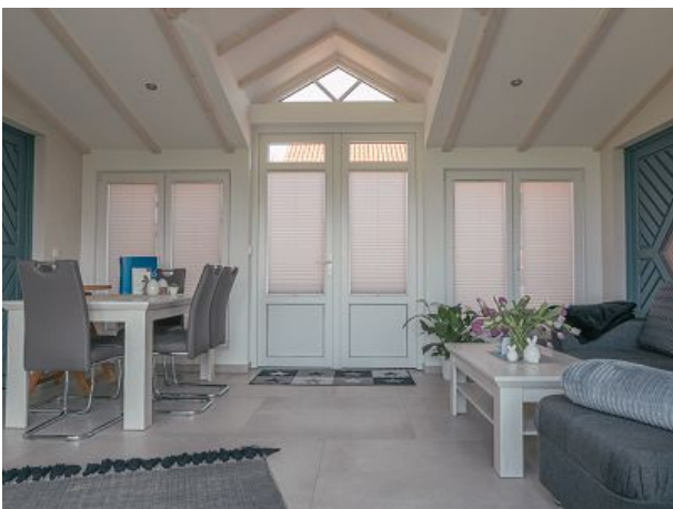
Wintergarten mit Eingangsbereich