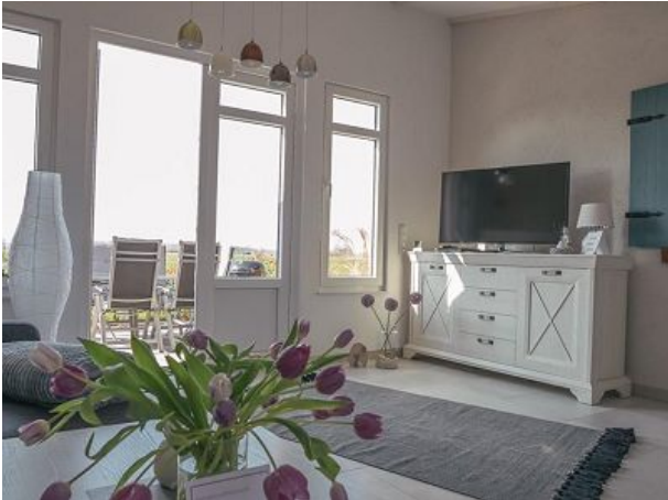
Wintergarten mit Blick auf die Terrasse