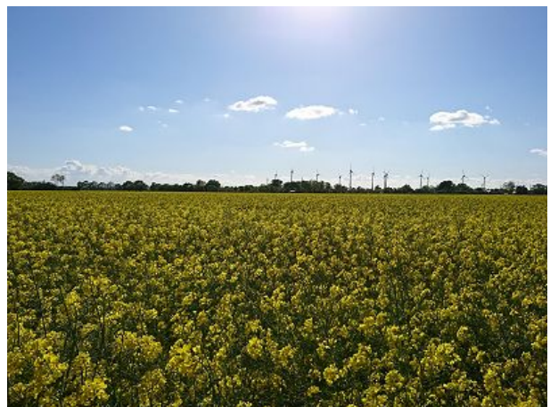
Ausblick Terrasse rechts zur Rapsblüte