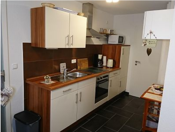
voll ausgestattete Küche