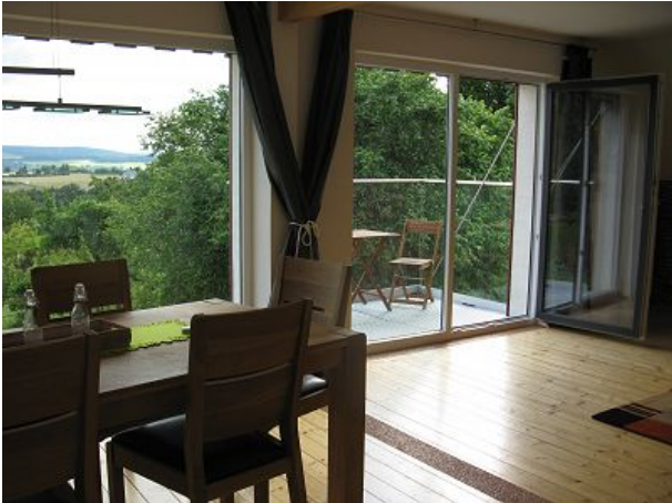
Talaue Esszimmer zum Balkon