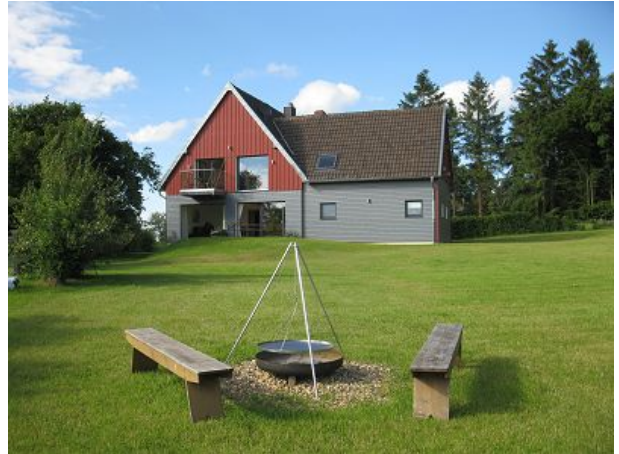
Das Burgberghaus von der Feuerstelle