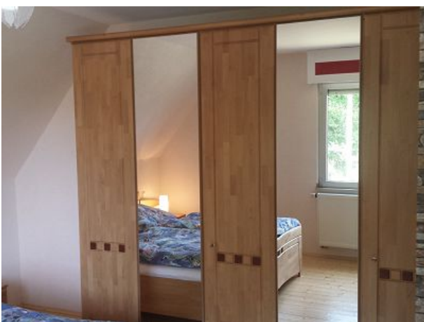
Talaue großes Schlafzimmer