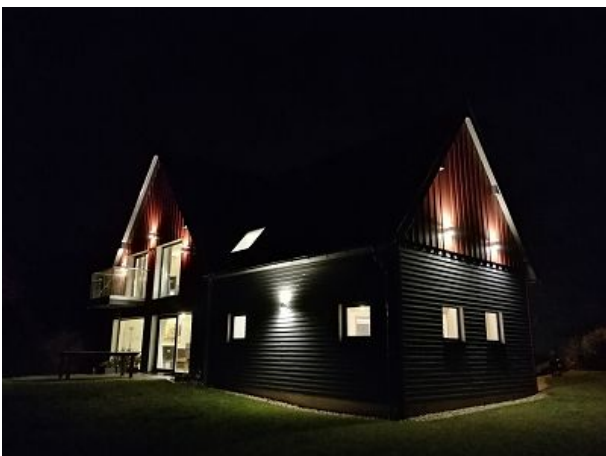
Burgberghaus bei Nacht