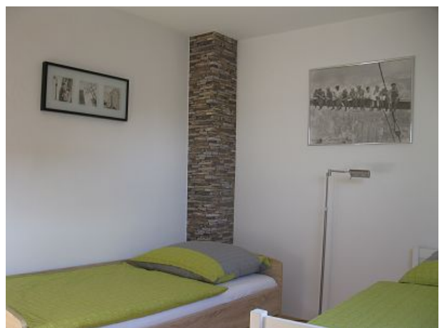
Talaue kleines Schlafzimmer