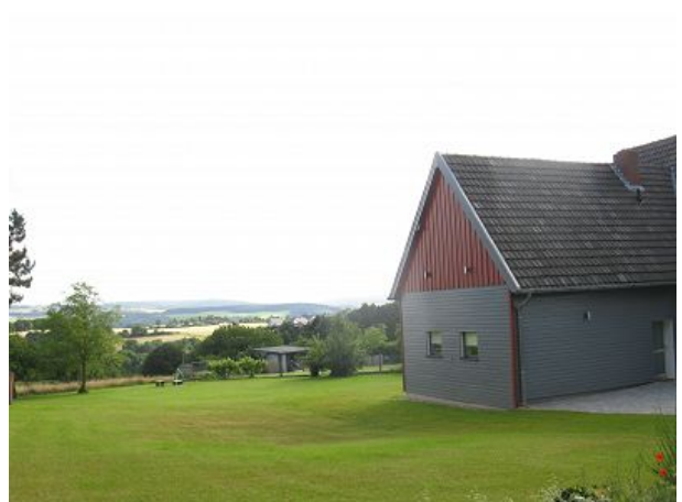
Blick auf den Garten von vorne