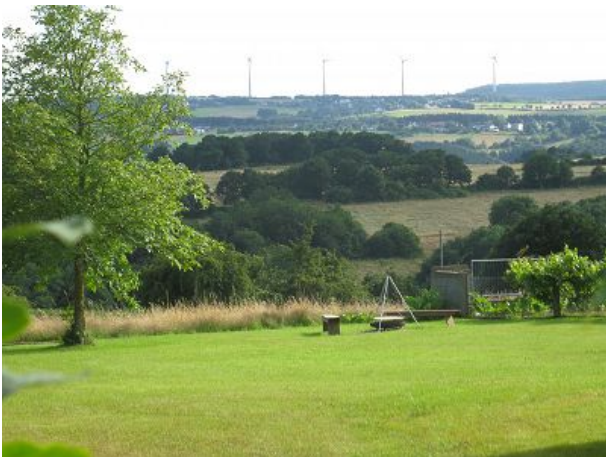
Blick auf den Nationalpark Eifel