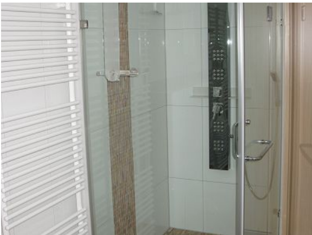
Talaue Badezimmer Dusche