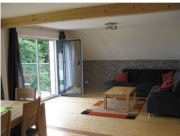
Talaue Wohnzimmer zum Balkon