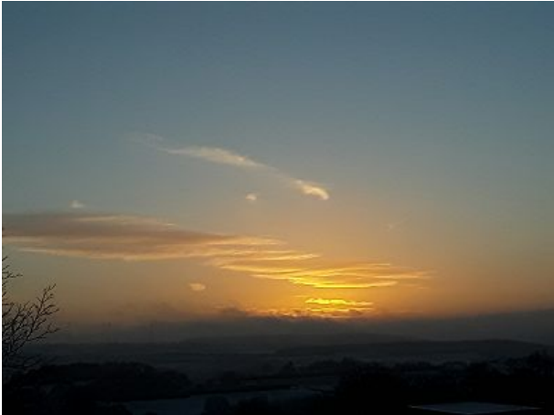
Sonnenuntergang im Winter