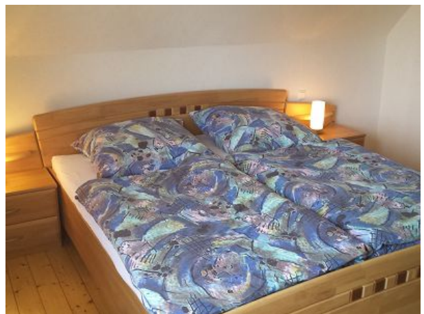
Talaue großes Schlafzimmer