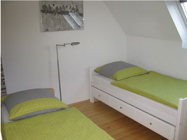
Talaue kleines Schlafzimmer