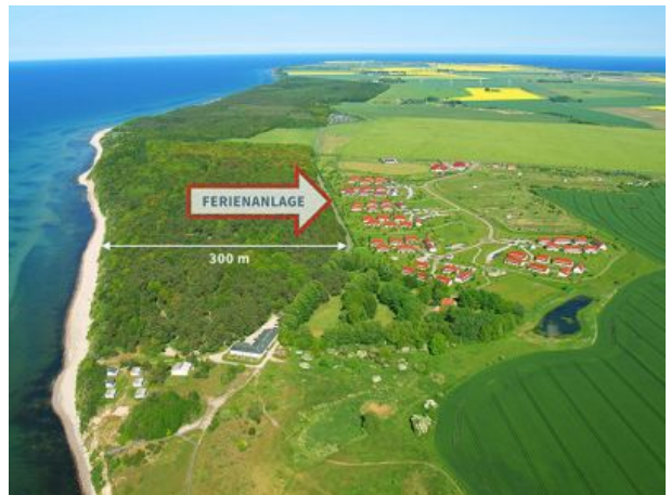
Der Blick von oben