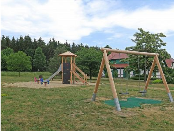
Spielplätze für die Kleinen