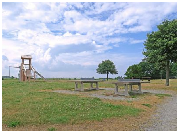
Spielplätze für Groß und Klein