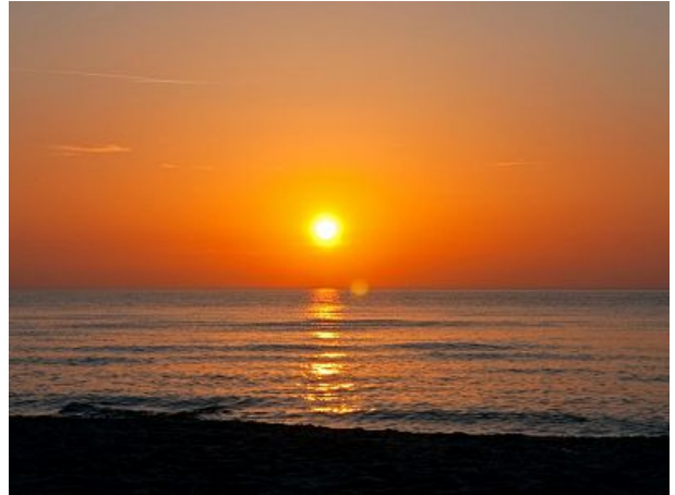
Der nahe Strand