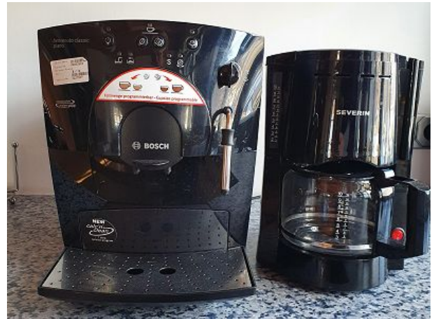
Kaffeevollautomat und Kaffeemaschine