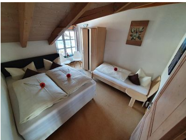
Kinderschlafzimmer mit Boxspringbett