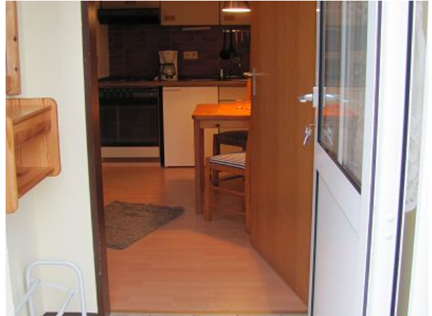
Eingangsbereich mit Blick in die Küche