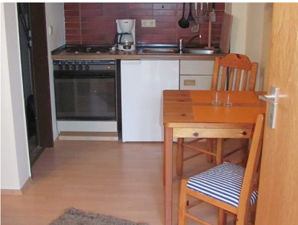
Küche mit Essplatz