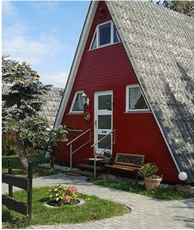
Eifeler Finnhaus Alleinlage