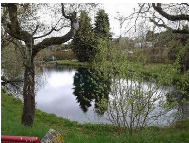
kleine Teiche in der Umgebung