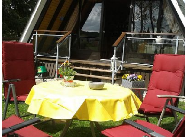
Gemütlichkeit im Außenbereich