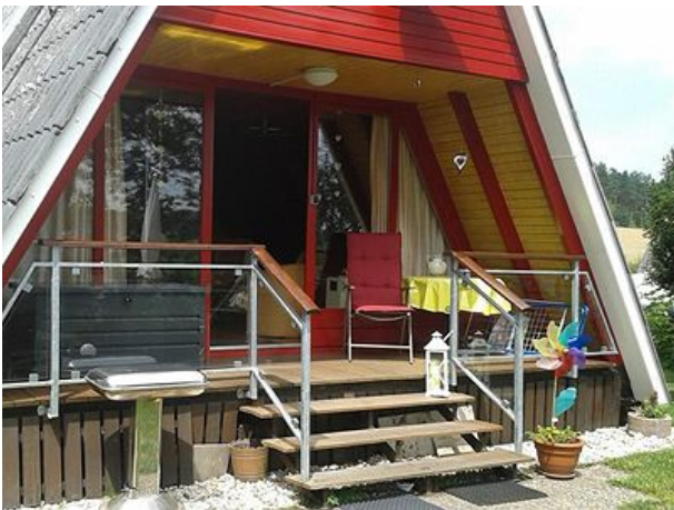
Terrasse des Eifeler Finnhauses