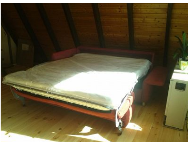
Schlafmöglichkeit mit sehr guter Matratz