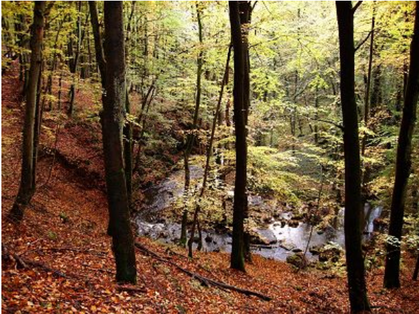
Eifelwald im Herbst