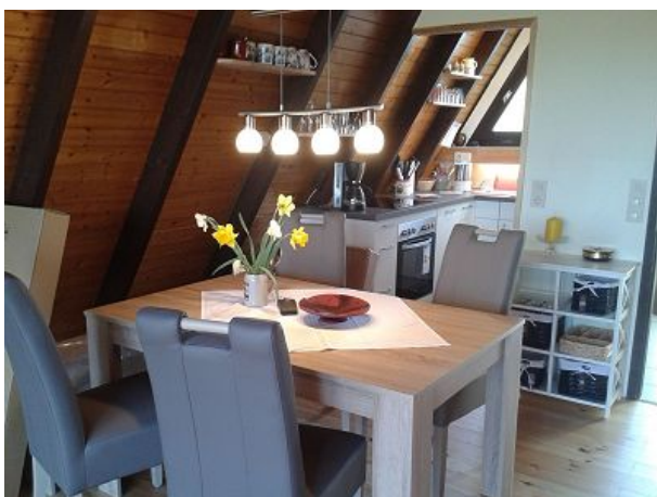
gemütlicher Essbereich für vier Personen