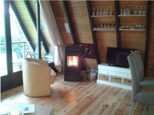
Wärmespender in der kalten Jahreszeit