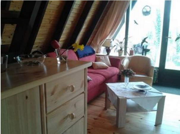
Wohnzimmer mit Blick nach draußen