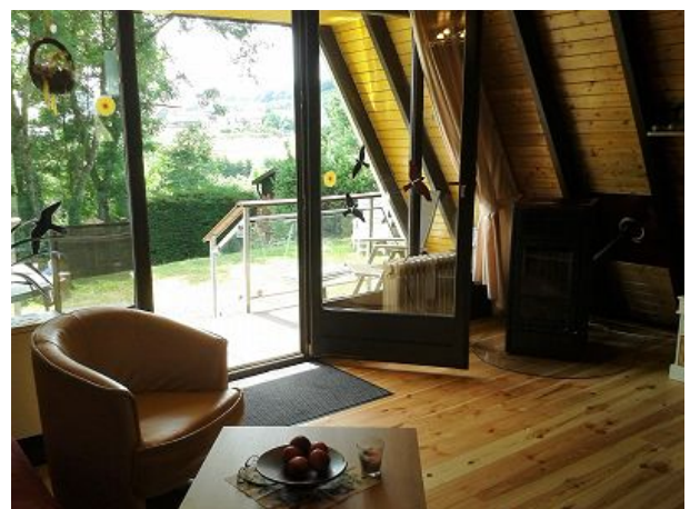
Blick nach draußen