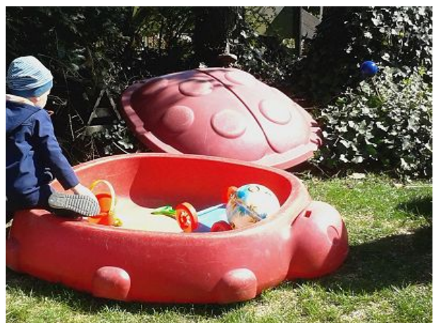
für die Kleinen besonders reizvoll