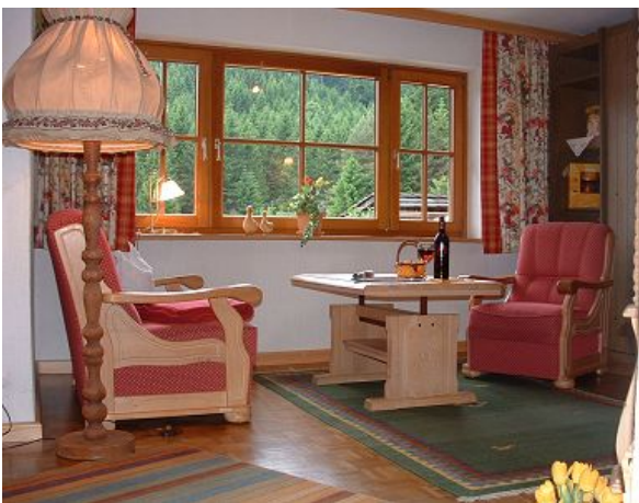
Weissenbach Wohnraum mit Blick zum Wald