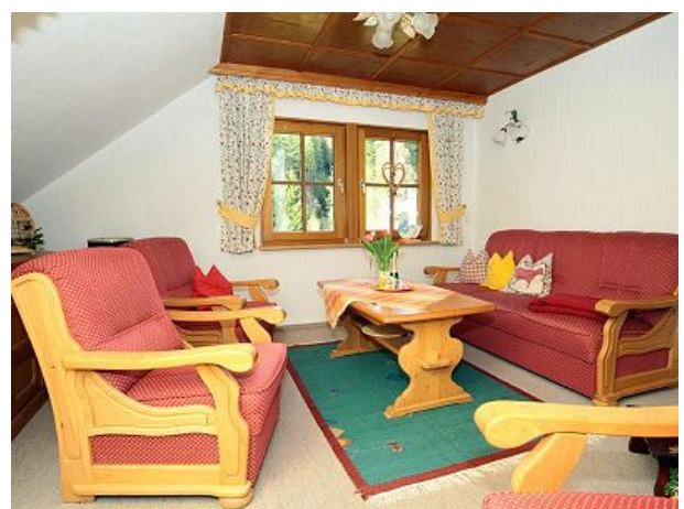
Oberrain hier ist viel Platz für alle