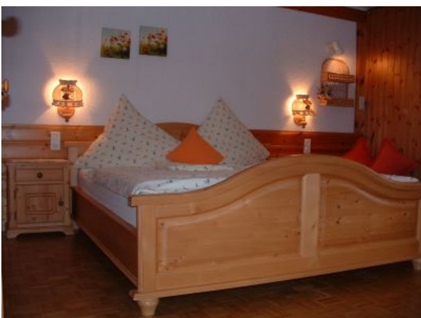
FEWO Weissenbach eine gute Nacht