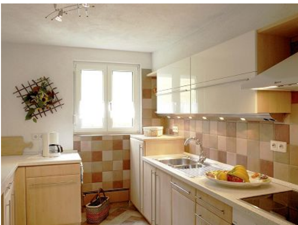
Talblick hier macht kochen Spass