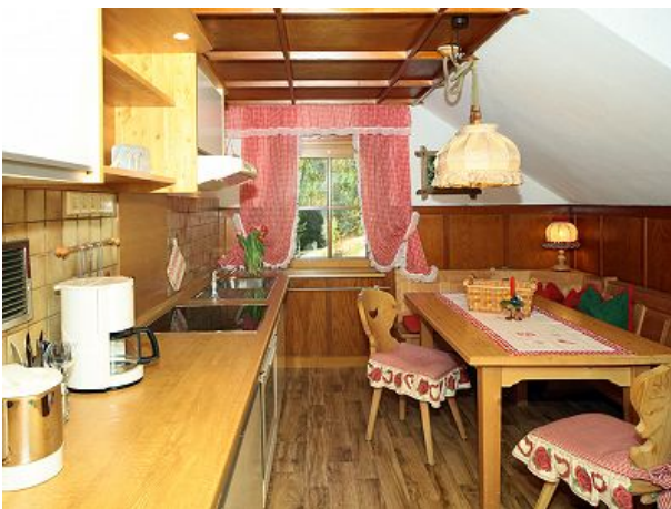
FEWO Oberrain hier ist Gemütlichkeit