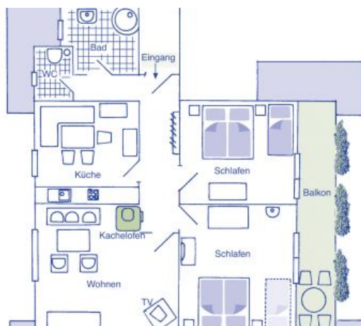
FEWO Oberrain einmalig