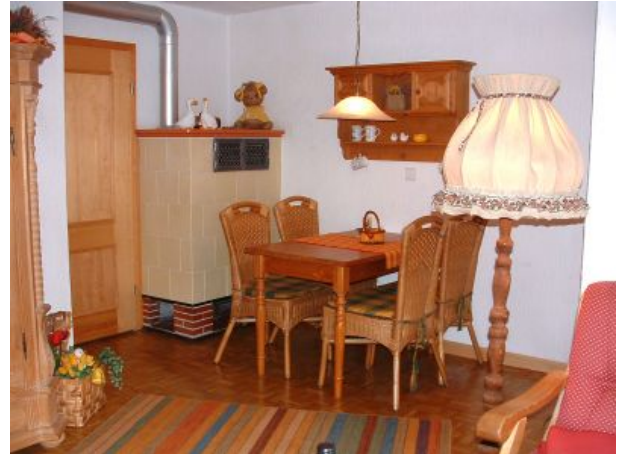
WEISSENBACH gemütliche Ecke am Kachelofen