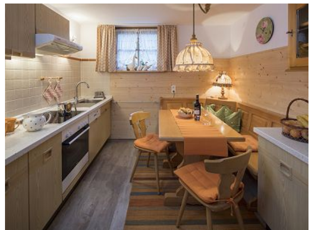
FeWo WEISSENBACH neue tolle Küche