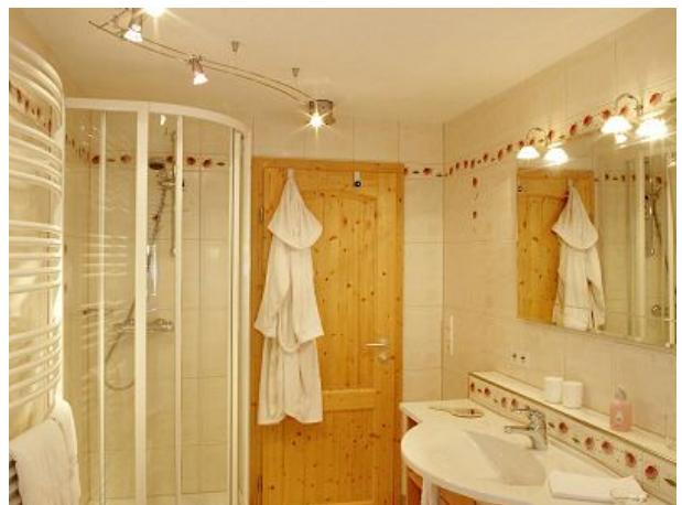
Talblick schöne Wellness Oase