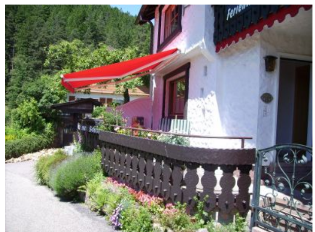
Weissenbach große Südterrasse