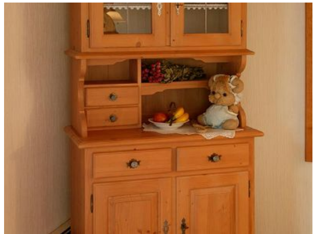
Talblick die kleinen Details