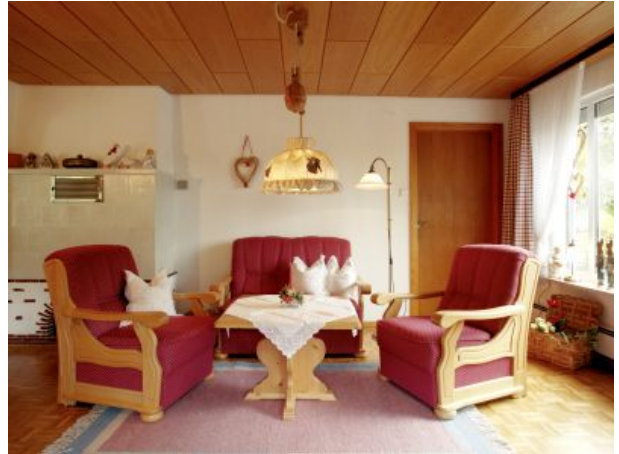
fünf Sterne Talblick einmalig Ausblick