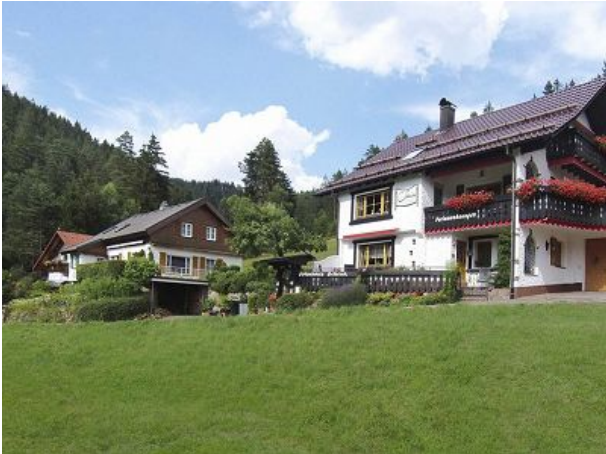
einmalige sehr ruhige bevorzugte Lage