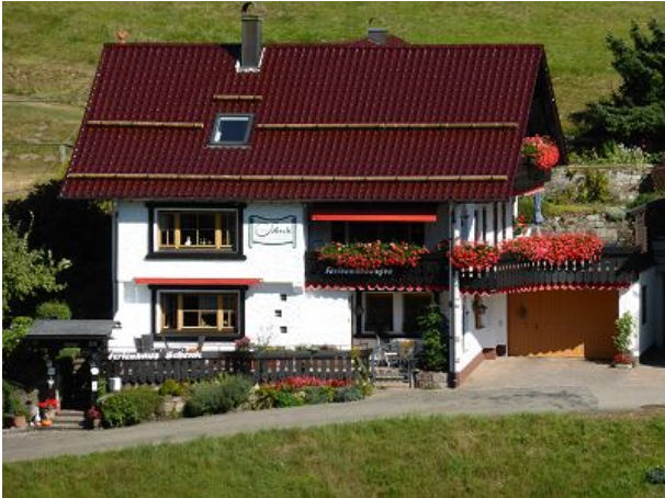
Haupthaus mit drei FeWo