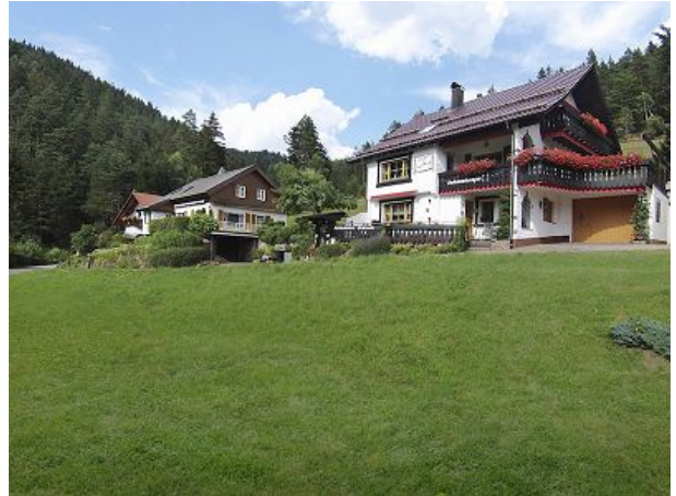
Landhaus u Haupthaus fünf Sterne