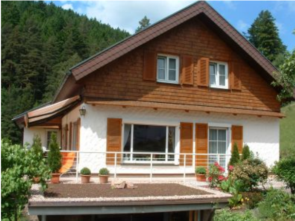
Landhaus mit FEWO Talblick