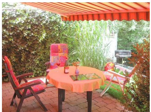
Eigene Terrasse mit Markise