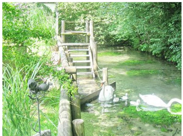
Kneippstelle im frischen Quellwasser