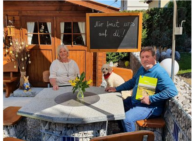
Ingrid Andi Leon mir freiet uns auf di