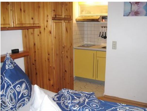
Dunstabzug nach außen