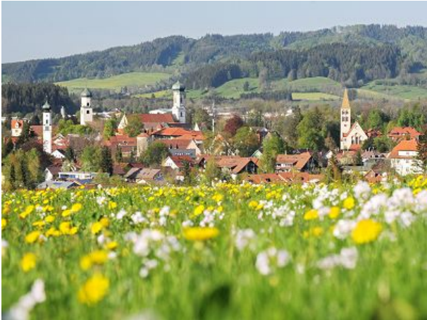
Isny im Allgäu im Mai