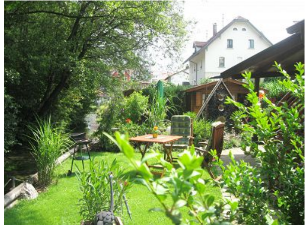
Gartenteil FEWO Sonnenschein