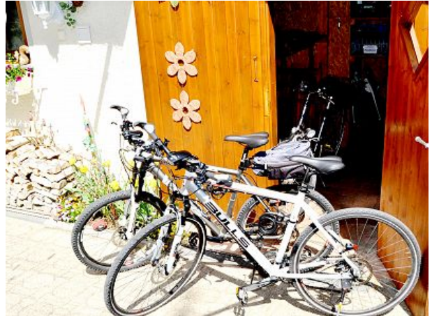
Fahrradschuppen mit Lademöglichkeit