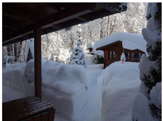
Winter bei uns