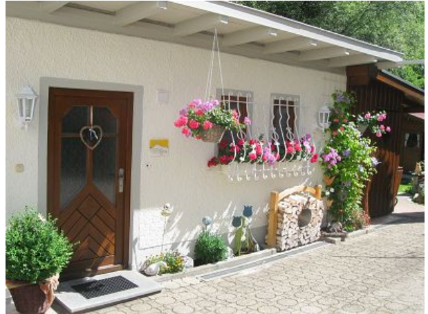
Separat im Nebengebäude