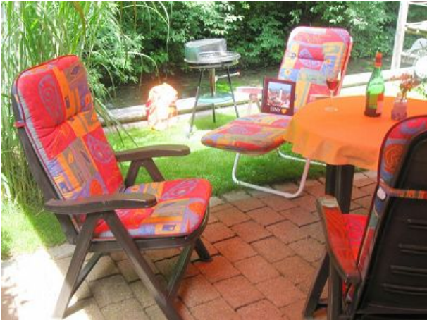
Terrasse direkt am Bach