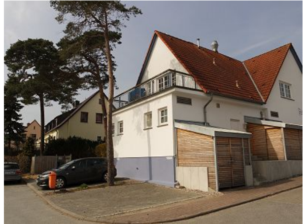
Parkplatz für Gäste