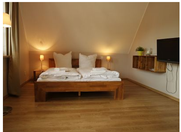
Appartement mit Dachterrasse