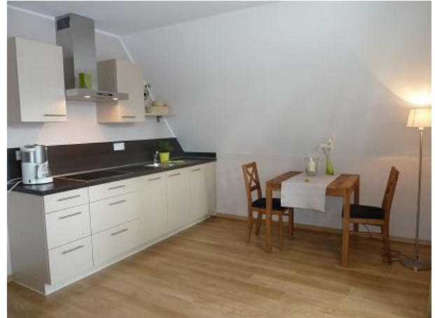
Einbauküche mit Geschirrspüler