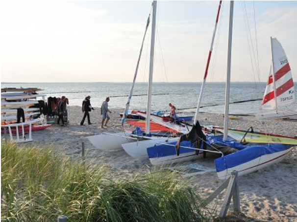
Segelschule am Strand