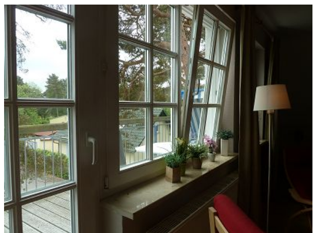
Blick aus dem Fenster