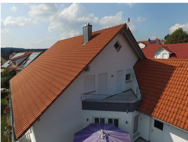
Morgensonne beim Aufwachen