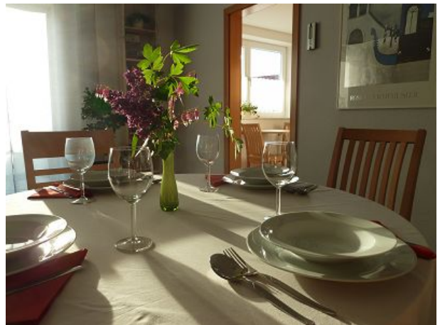
Wohn und Esszimmer