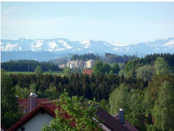
Die Alpen im Blick