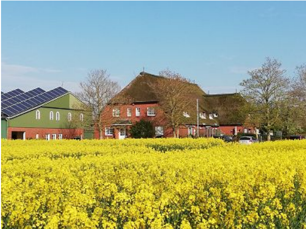
Hausansicht mit Rapsfeld