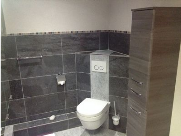
Badezimmer mit WC