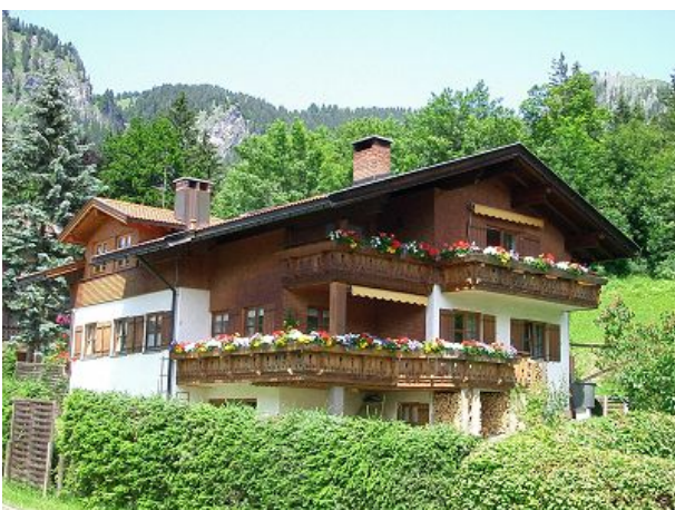
Wohnung oben rechts