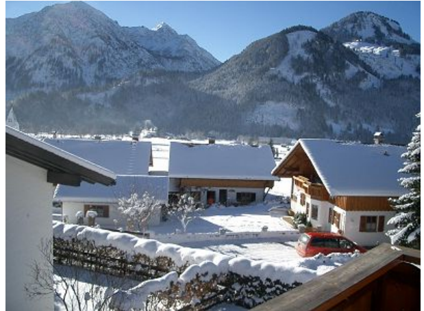
Ausblick im Winter