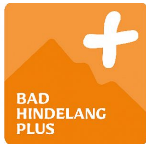
kostenlose Leistungen mit Bad Hindelang