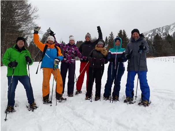
Snowacademy Schneeschuh Wanderung