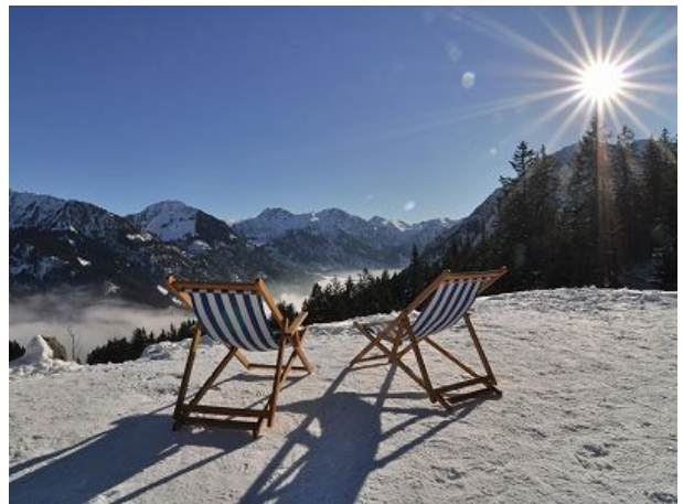
Erholung in der Wintersonne am Horn