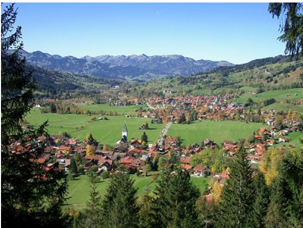
Blick nach Bad Oberdorf