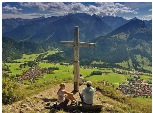
Blick vom Hirschberg nach Bad Hindelang