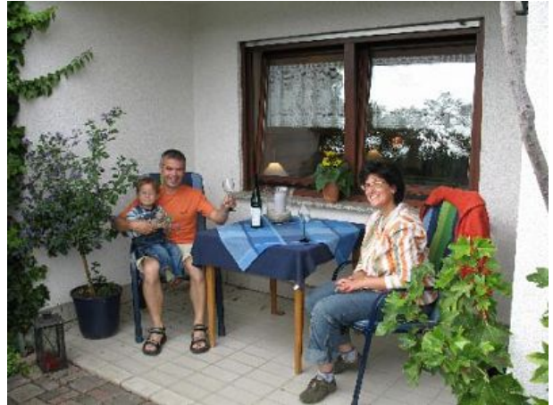
Überdachte Terrasse mit Markise