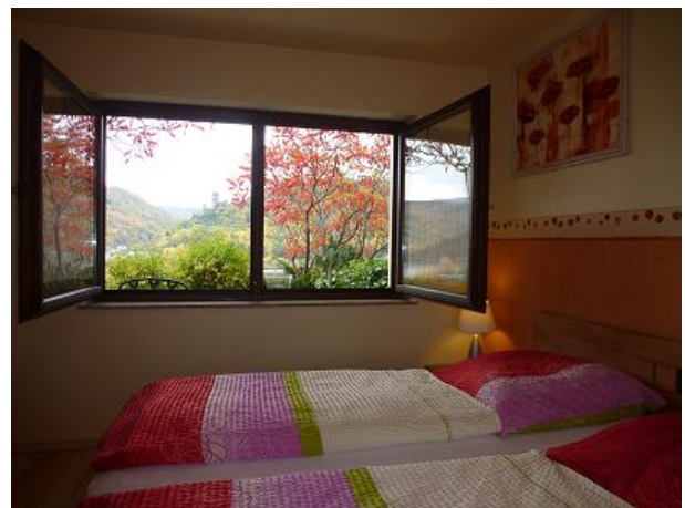
Blick aus dem Schlafzimmer