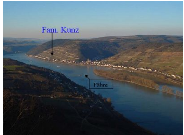
Lage unserer FEWO