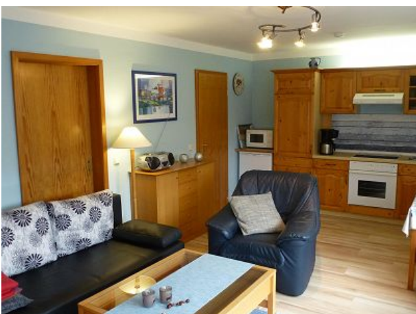
Wohnküche mit Schlafcouch