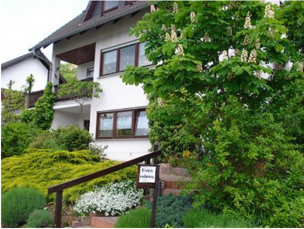
Ferienwohnung im Erdgeschoss