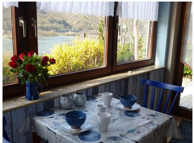
Esstisch mit Rheinblick