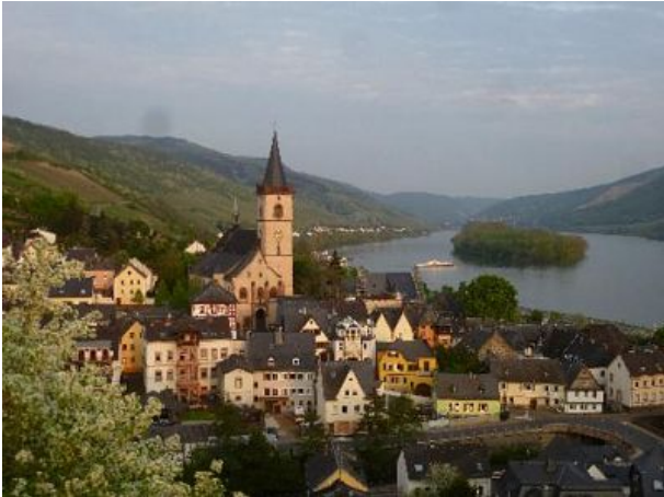
Lorch mit der Sankt Martinskirche