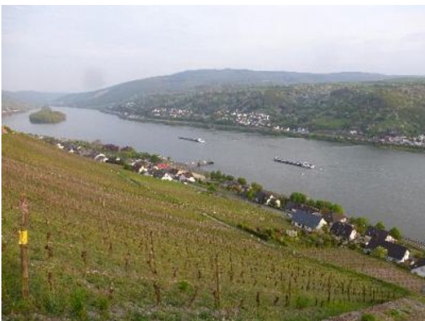
Unser Haus unten rechts