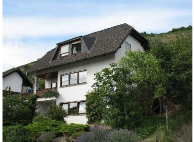
FEWO im Erdgeschoss