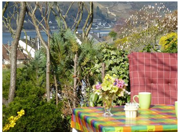
Blick Richtung Bacharach