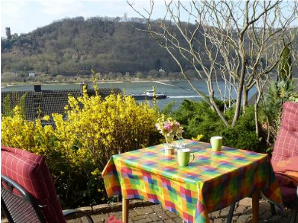
Aussichtsterrasse - Ruine Fürstenberg