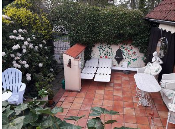
Hier sind Sie auf der Sonnenseite