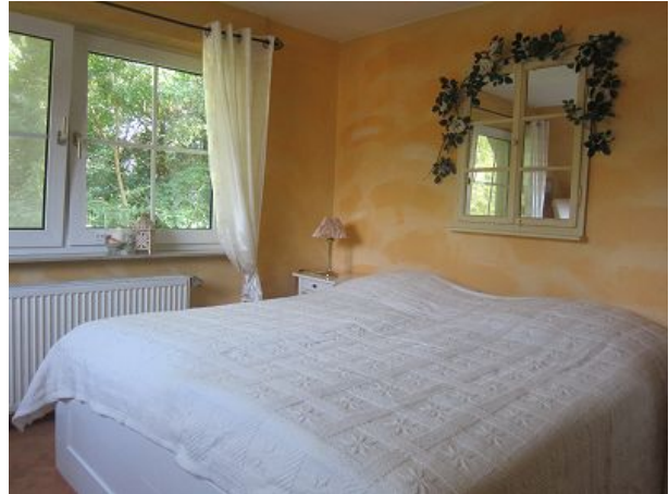
Schlafzimmer eins mit Fernseher