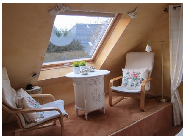
Schlafzimmer eins Lesecke