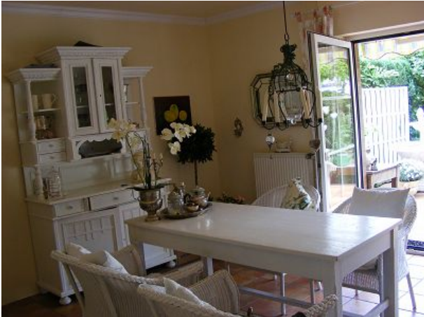
Esszimmer und Terrasse