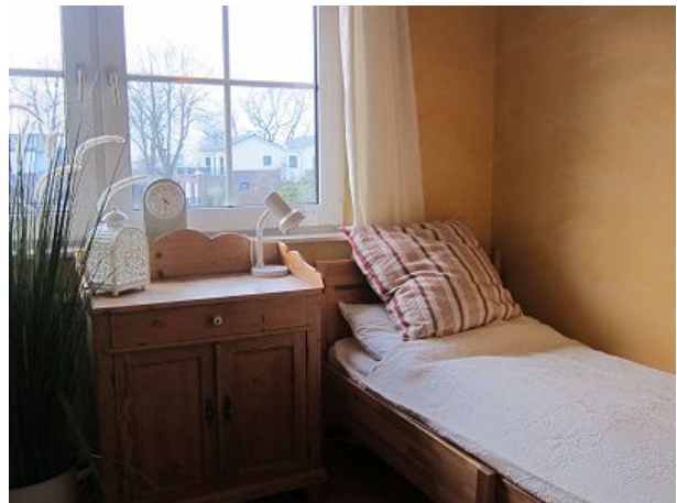
Schlafzimmer drei mit Kleiderschrank