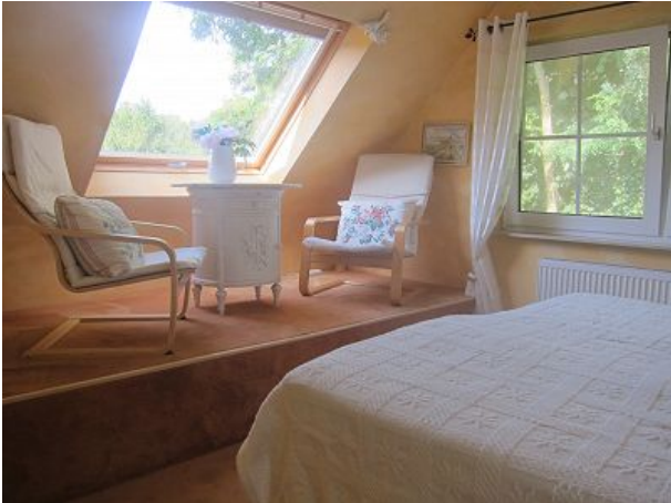
Schlafzimmer eins mit Meerblick