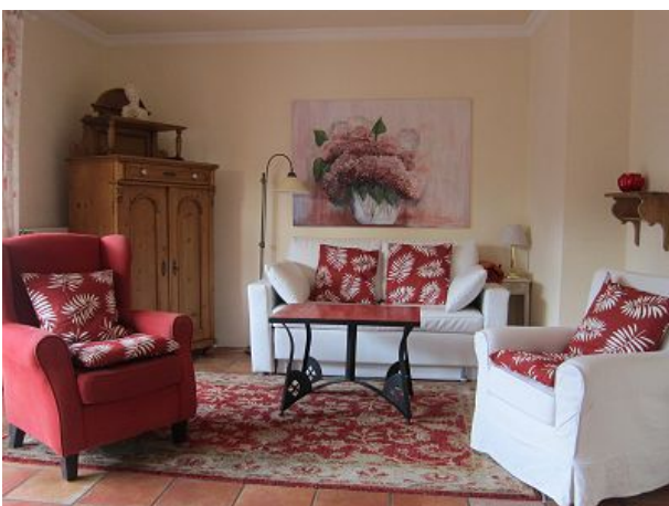
Wohnzimmer mit Fernseher