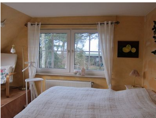
Schlafzimmer eins Meerblick