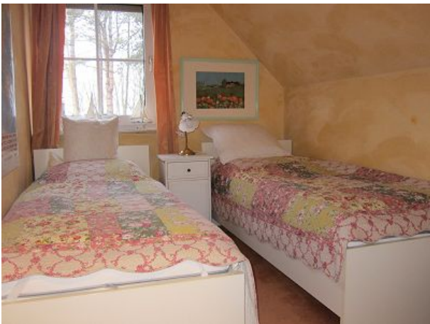
Schlafzimmer zwei Meerblick