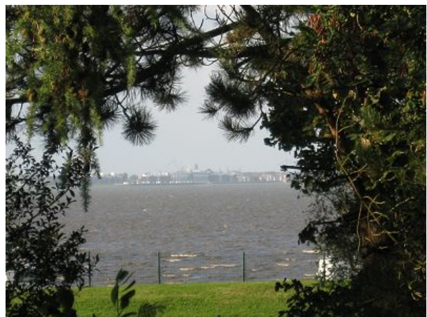
Meerblick vom Schlafzimmer zoom