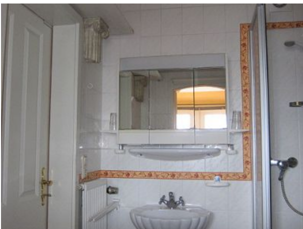
Bad Dusche Toilette