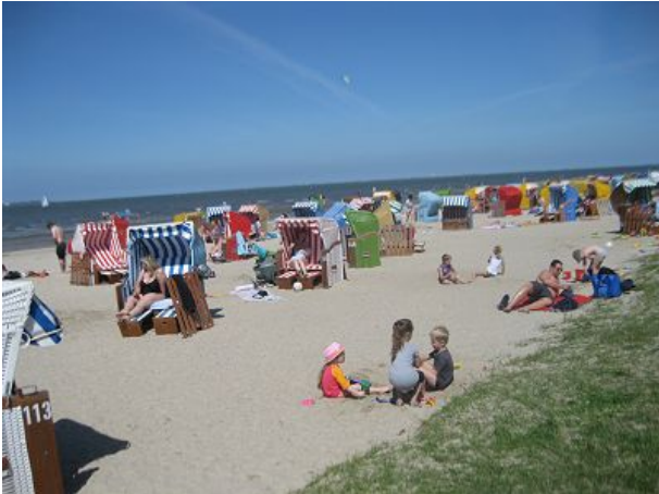
Einhundertmeter vom Ferienhaus