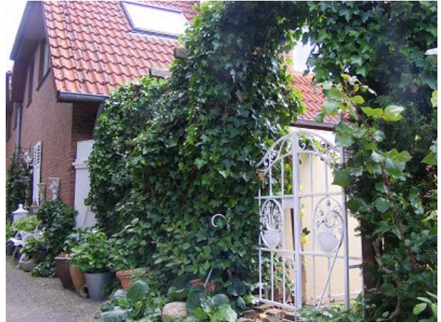
Haus Jadeblick II