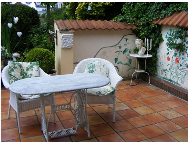
Seele baumeln lassen