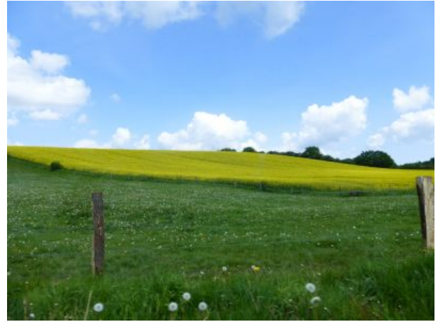
Ein Rapsfeld in Dithmarschen