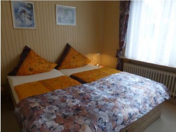
Schlafzimmer zur Vorderseite