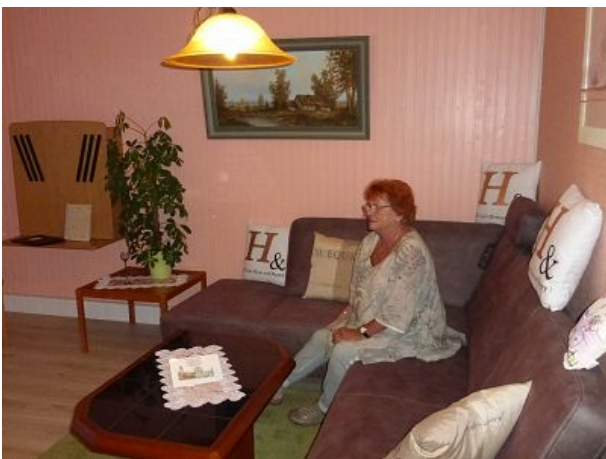
Die gemütliche Couch