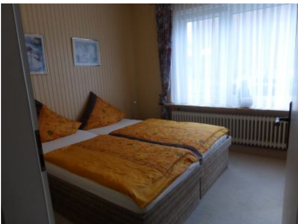
Schlafstube mit Senoren Betten