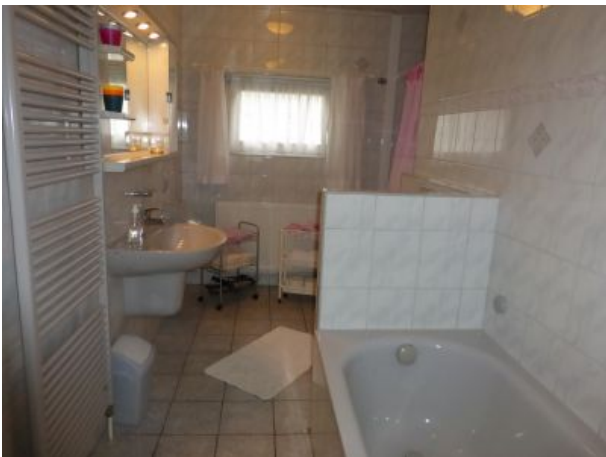
Badezimmer mit Wanne und Dusche