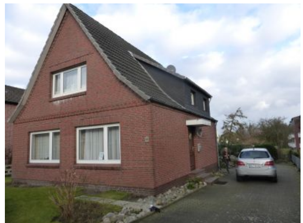
Ein Parkplatz pro Wohnung ist vorhanden