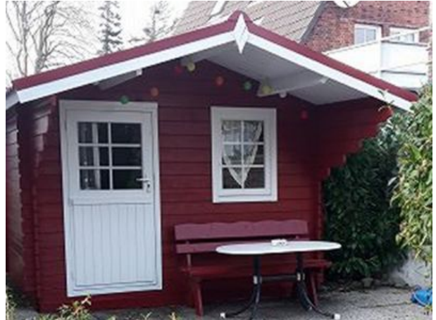
Das Gartenhaus zum gemütlichen sitzen