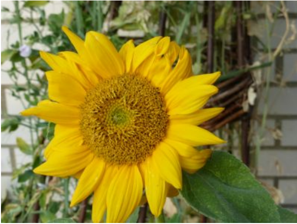
Und immer wieder geht die Sonne auf