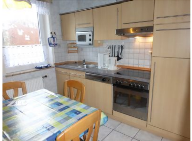
Küche mit Geschirrspüler