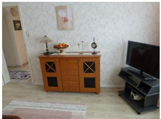
Sat TV und Komode im Wohnraum