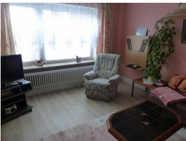
Wohnzimmer mit Fernsehsessel