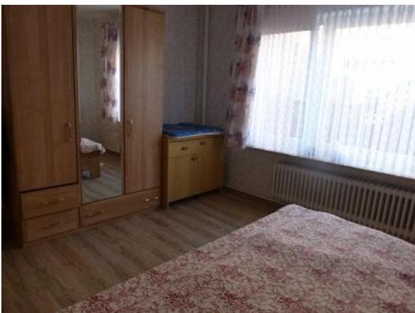
Schlafzimmerschrank im Doppelbett Zimm