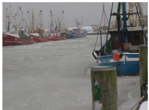
Der Büsumer Hafen im Winter