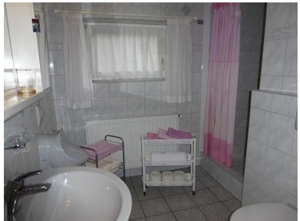
Badestube mit extra große Dusche