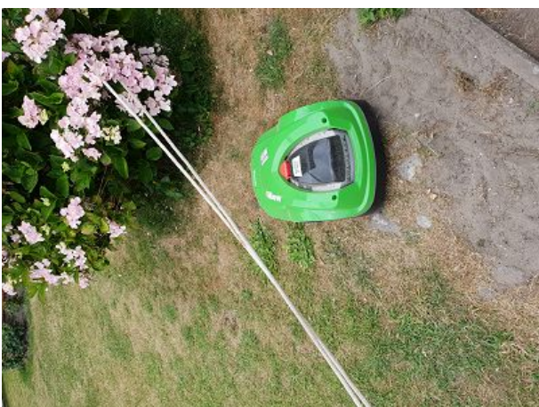
Unser fleißiger Mitarbeiter