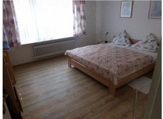
Schlafrum mit Doppelbetten