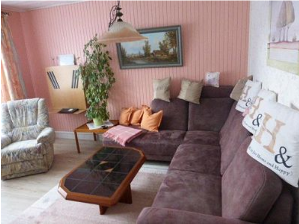
Der gemütliche Wohnraum im Erdgeschoss