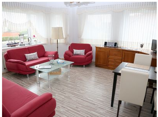
Wohnzimmer mit Essecke