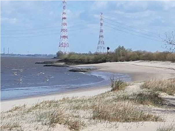
Sandstrand ganz in der Nähe