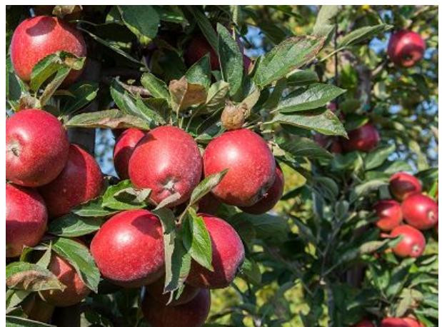
Apfelernte im Herbst