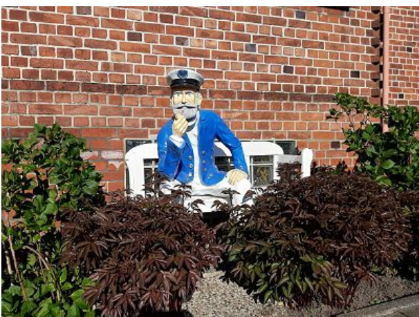
Kapitän vor dem Alten Lotsenhaus