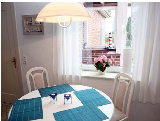
Küche mit Essecke