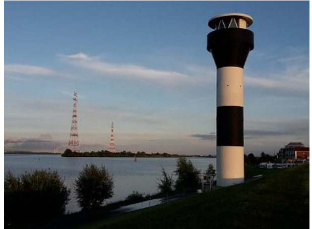
Blick direkt vom Deich auf die Elbe