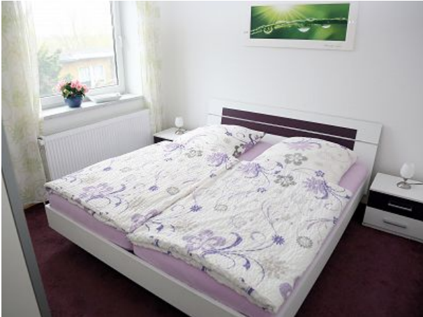
Schlafzimmer mit Doppelbett