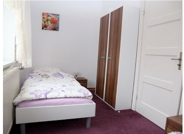
Schlafzimmer mit zwei Einzelbetten