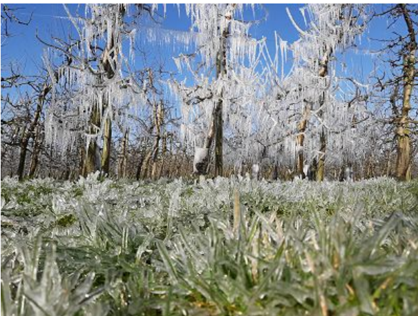
Beregnung der Obstbäume bei Frost