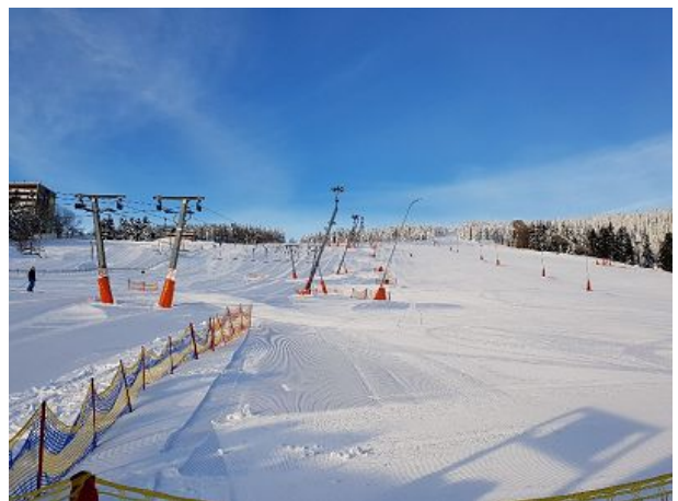
Hauptskihang direkt am Haus