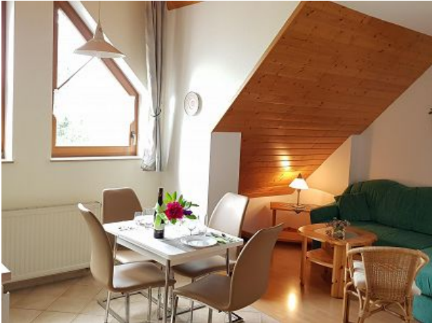
Blick Esstisch und Sitzecke