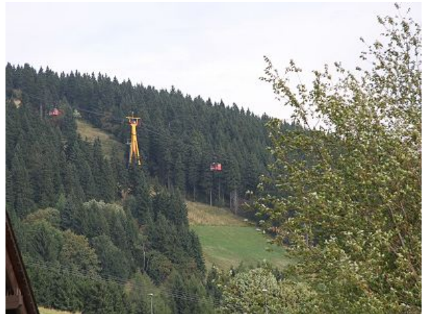
Blick zur Schwebbahn