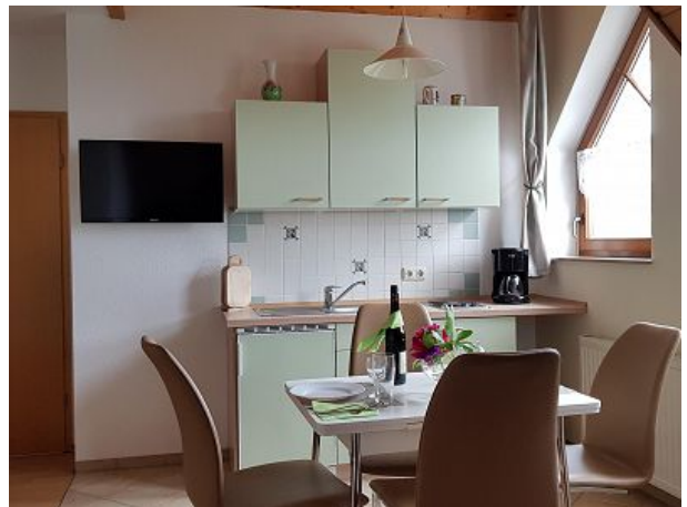
Küchenzeile und Flach-TV