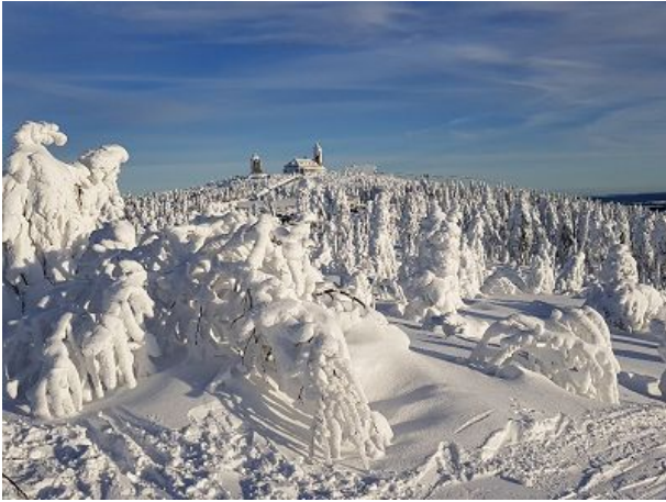
Winterlandschaft am Fichtelberg