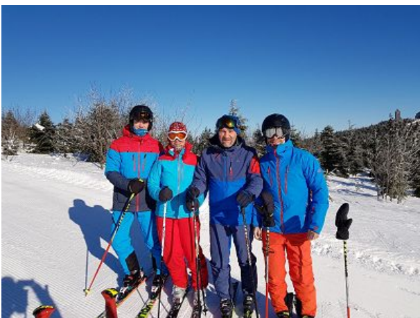
Familie Eibisch beim Skifahren