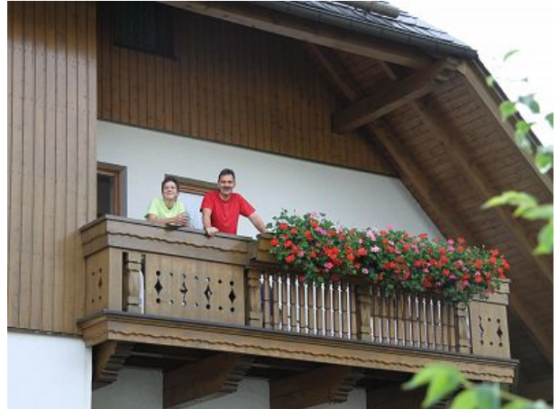
Balkon mit Panoramablick