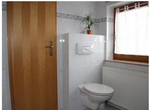
WC mit Fenster