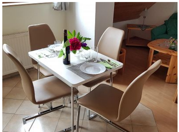
Esstisch hell und freundlich