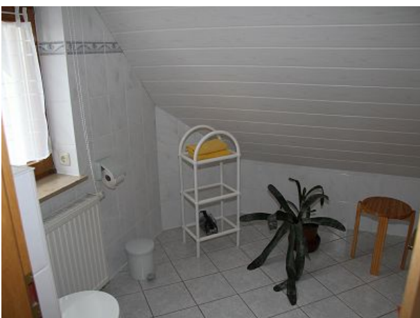
Duche und WC mit Fenster