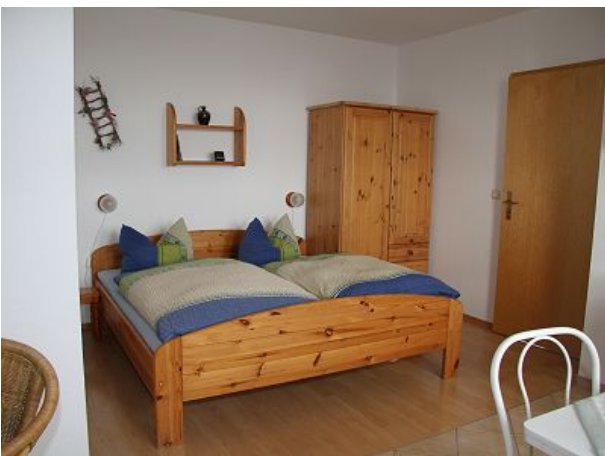
Doppelbett und Kleiderschrank