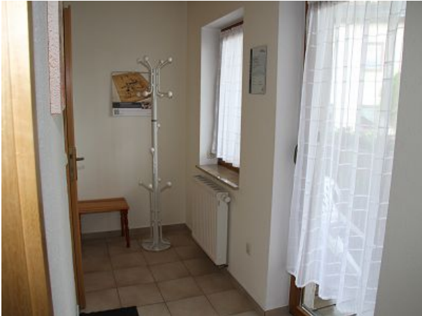
Flur mit Zugang zum Balkon