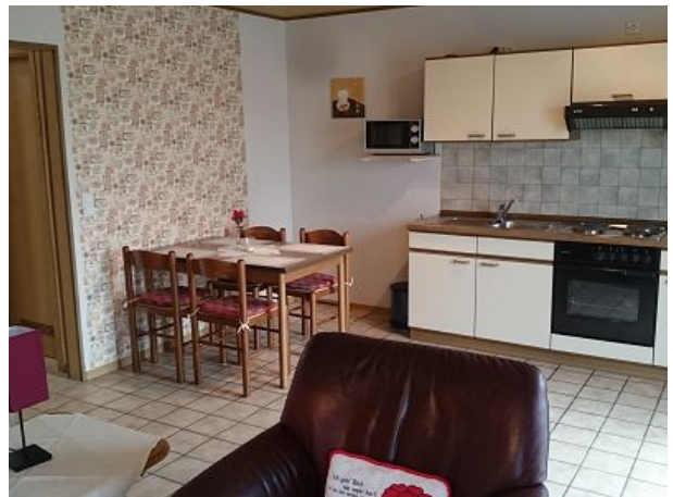
genügend Platz zum Essen