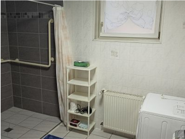
große befahrbare Dusche