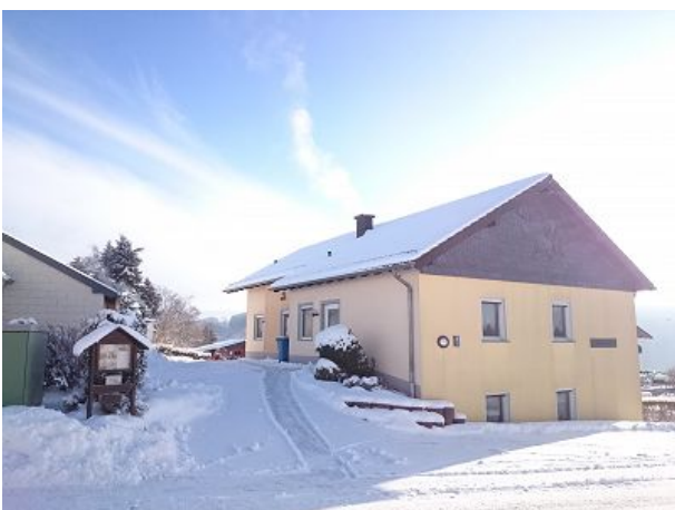
Auch im Winter eine Reise wert