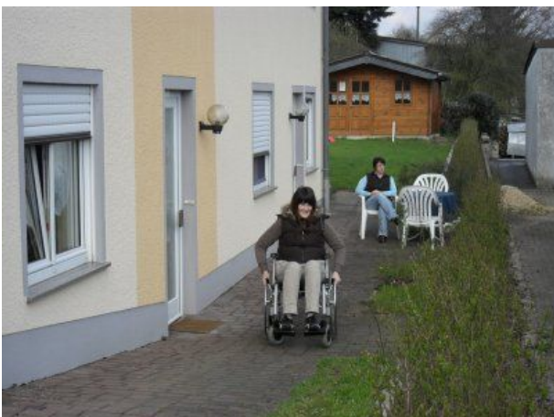
rund ums Haus für Rollis geeignet