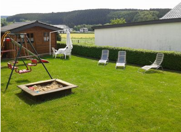
relaxen oder spielen im Garten