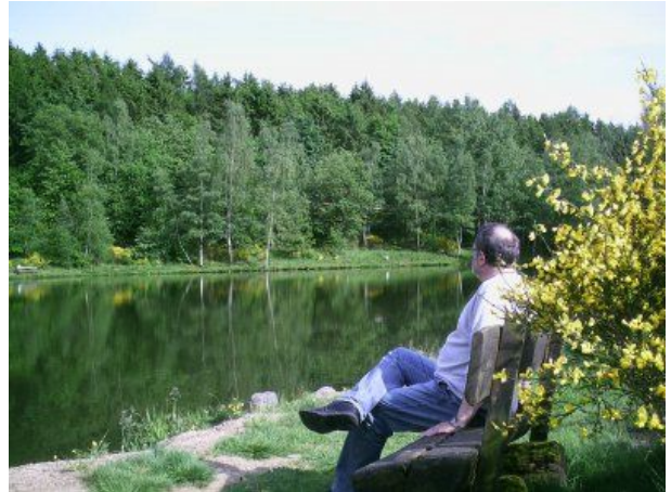
Entspannen am Angelteich Bleialf