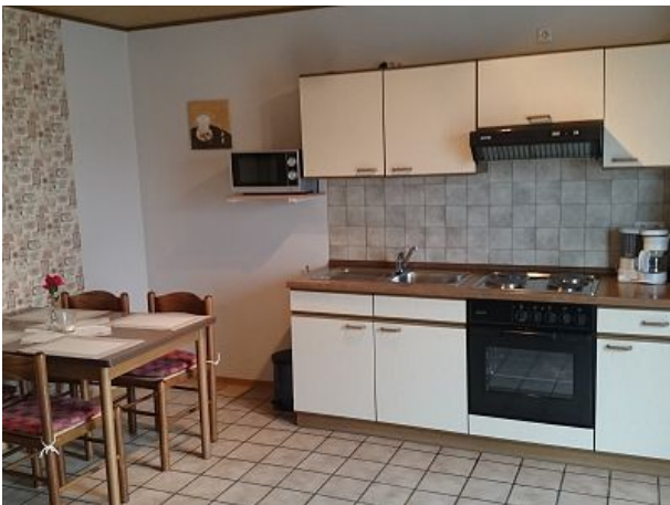
gut ausgestattete Küchenzeile