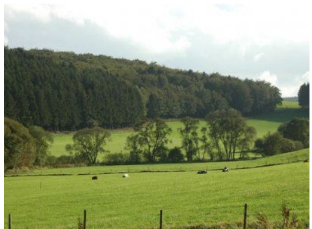
Blick ins Alfbachtal