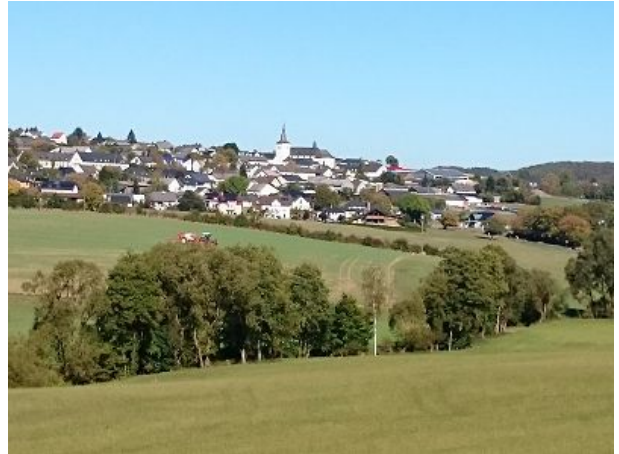
Blick auf Bleialf