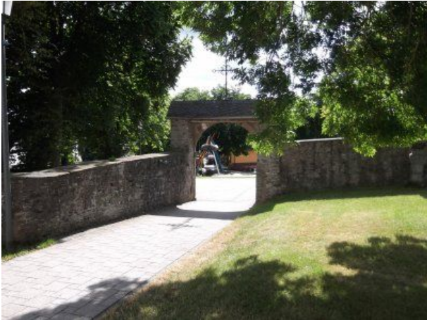
alte Kirchenmauer und Dorfbrunnen