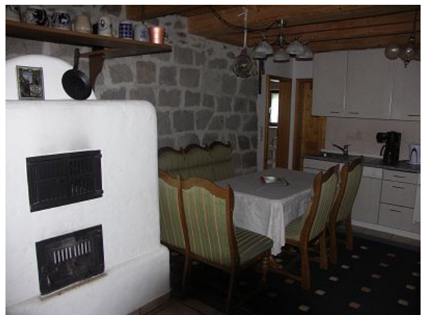
Holzofen und Essecke