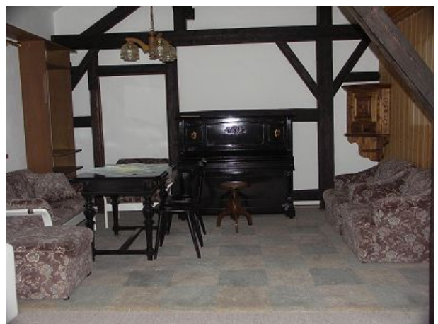
Wohnzimmer mit Klavier