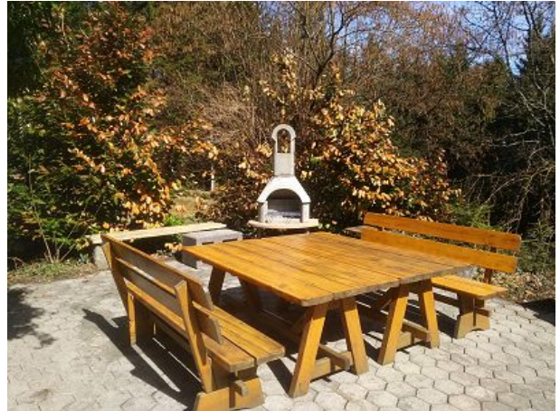
Terrasse mit Grill