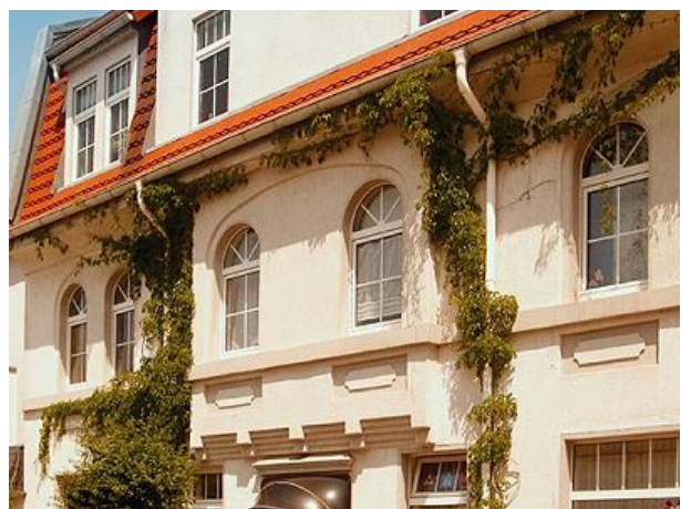
Hausansicht - FEWO