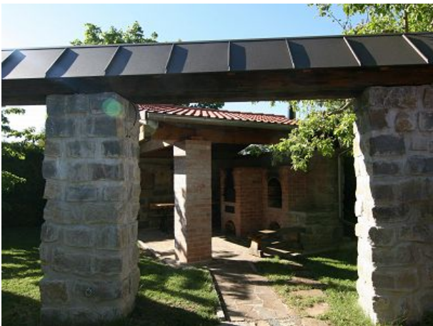
Garten und Grillplatz