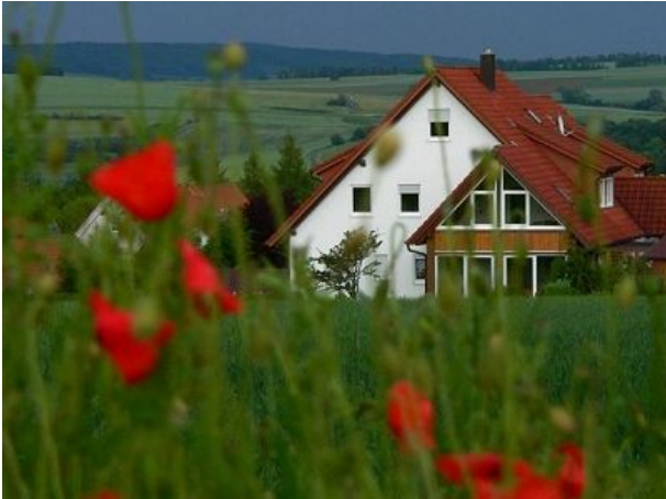
FW oben mit Balkon