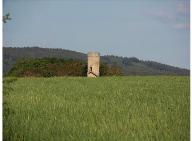
Gleich um die Ecke