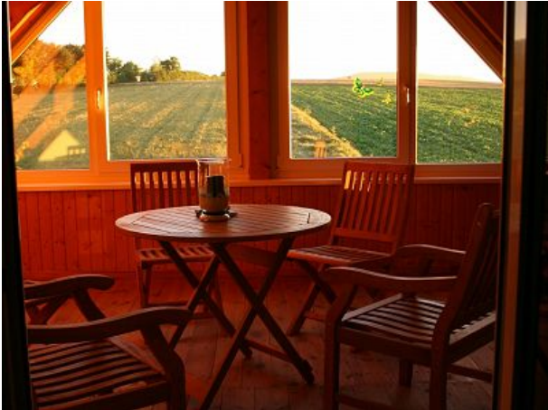
Balkon mit Fernsicht