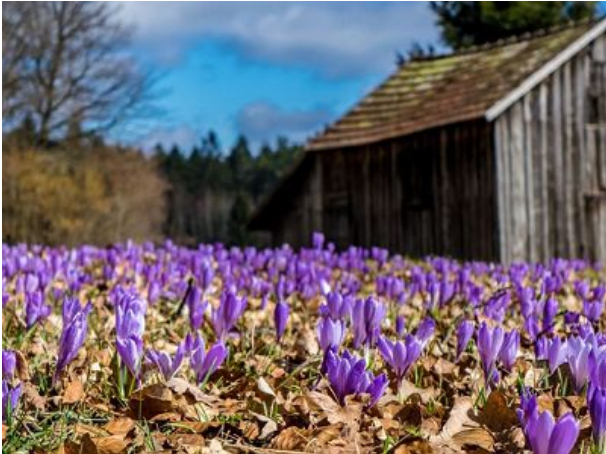
Krokusblüte in Zavelstein