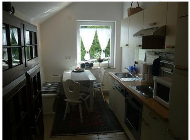
Küche mit Eckbank