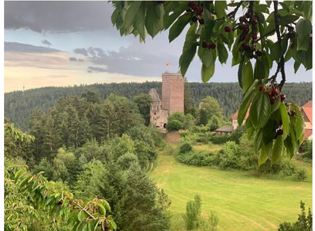
Blick Zur Burg