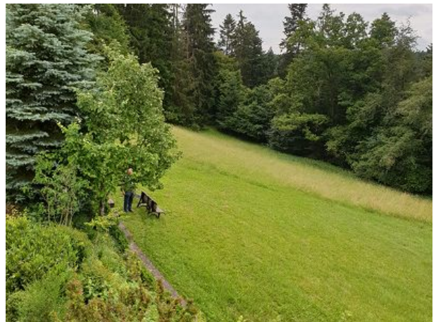
Blick ins Grüne