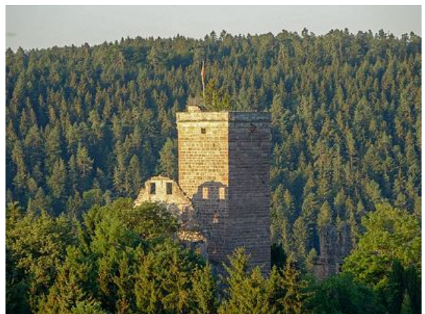
Die Burg Zavelstein