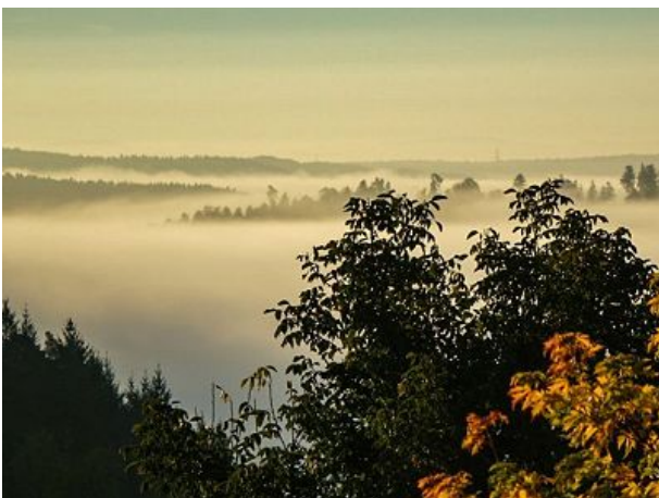
Der Nebel lichtet sich