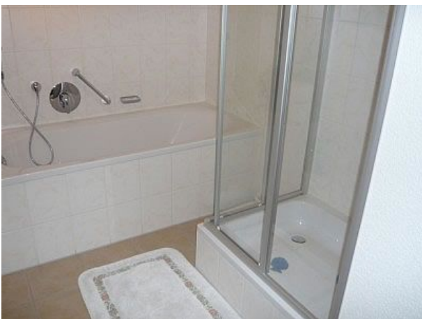
Badewanne und Dusche