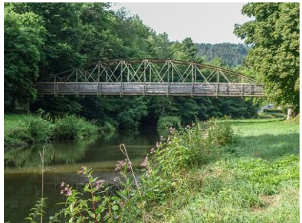
Spazier- und Wanderweg an der Nagold