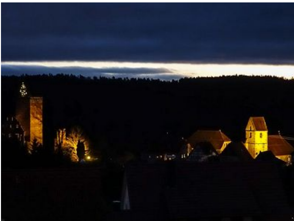
Zavelstein bei Nacht