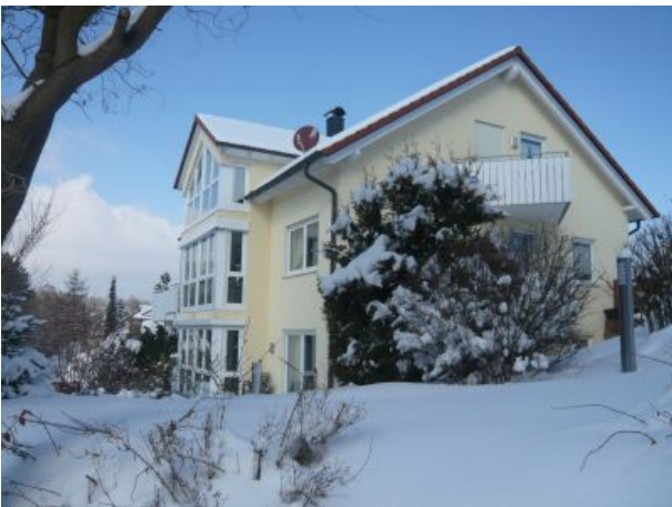
Haus Krauss im Winter