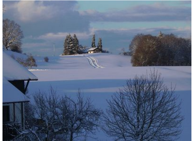
Blick auf die Langlaufloipe