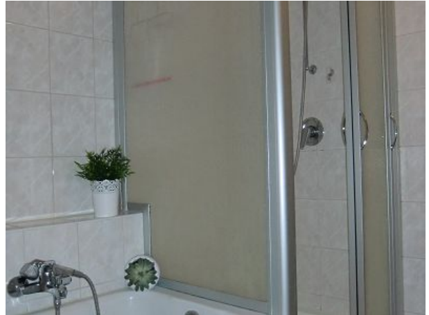
und hier die Dusche