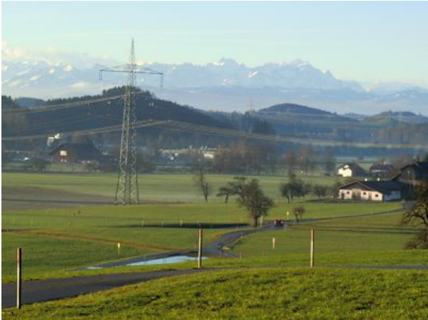
welches wunderschöne Bergpanorama