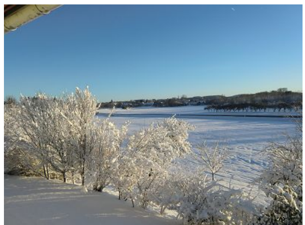
dort vorn liegt Wangen