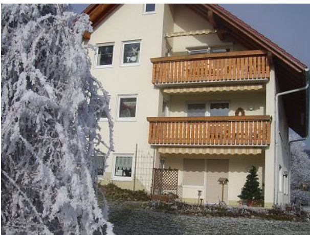
der obere Balkon ist Ihrer