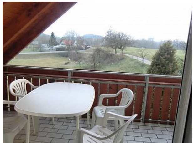
Südbalkon mit toller Aussicht