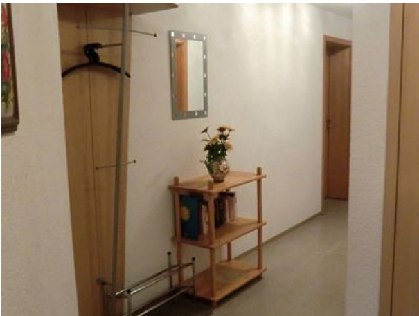
Ankommen und wie Zu Hause fühlen