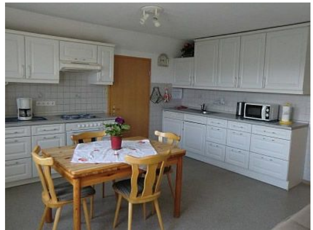
Ihr zu Hause für die nächsten Tage