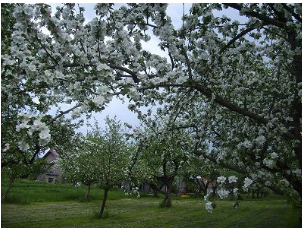
ein Meer von Apfelblüten