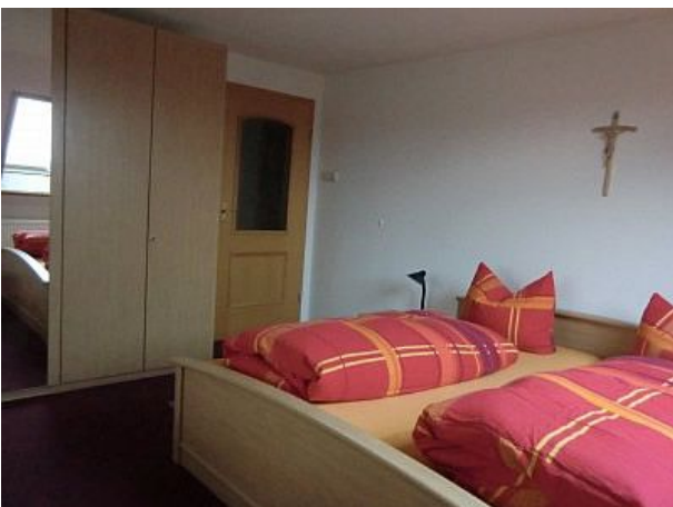
Elternschlafzimmer mit Sitzecke