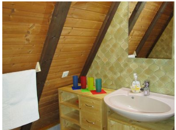
Dusche rechts neben dem Waschbecken