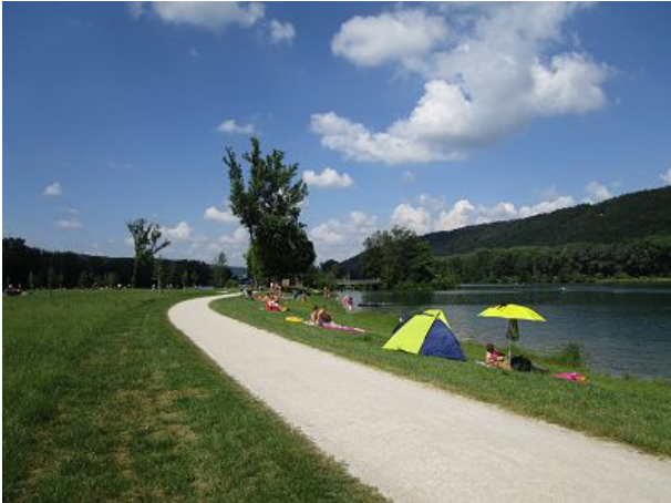
Eine der Liegewiesen am See