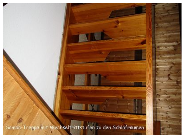
Samba-Treppe mit Wechseltrittstufen zu den Schlafräumen