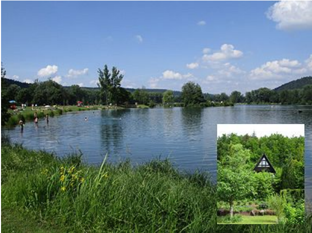
Zum Badeseesee siebenhundert Meter Fußweg