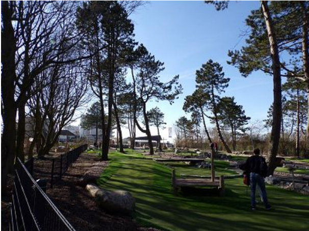
Adventuregolf am Duhner Kreisel