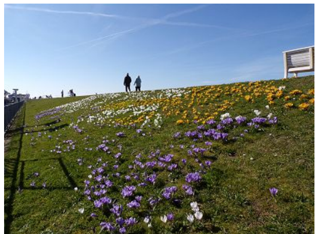
Blumenpracht am Deich