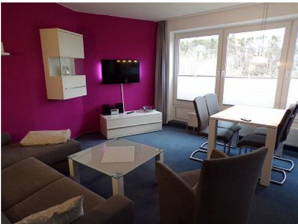
Wohnraum mit Farb - TV