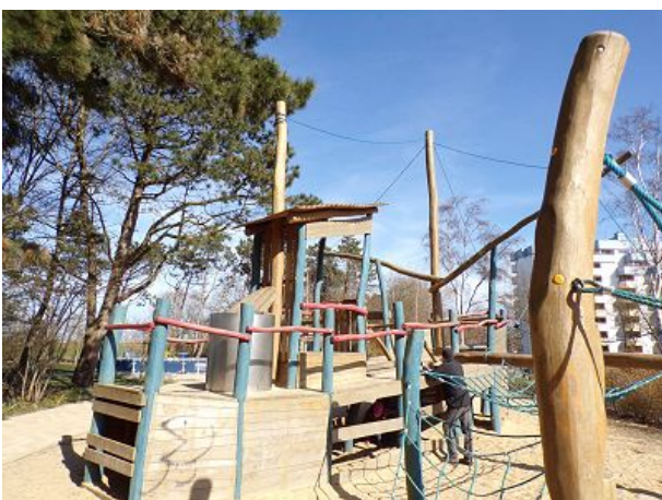
Spielplatz am Duhner Kreisel