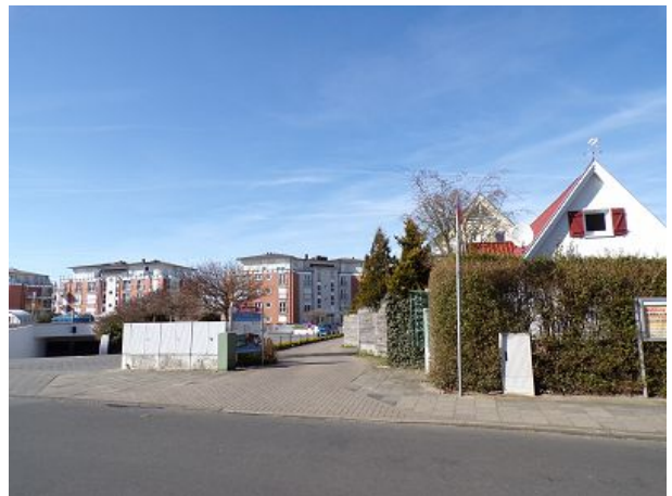
Einfahrt zur Residenz Meeresbrandung