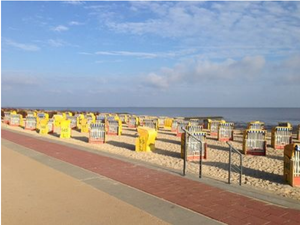
Morgens am Sandstrand