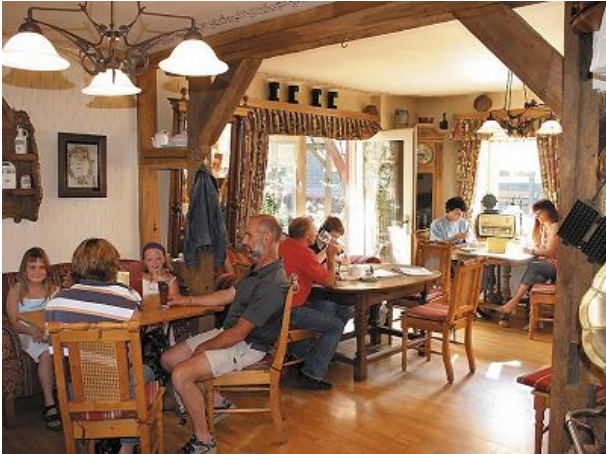
Unser Restaurant im Erdgeschoss