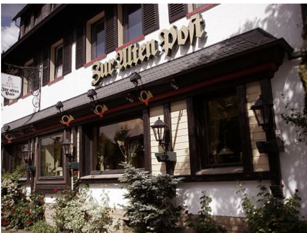
Unser Hotel Garni gegenüberliegend