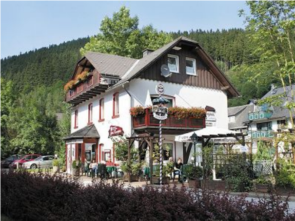
Unser Haus mit Ferienwohnungen